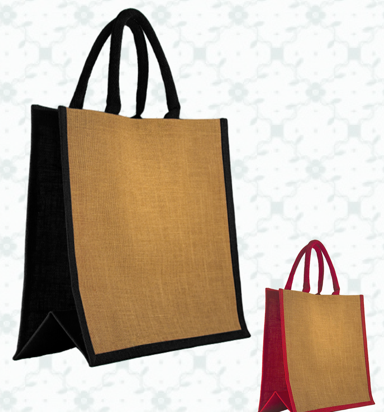
Ref : Sac toile de jute HBJ14 40 + 19 x 35 cm - 6 coloris disponibles Personnalisation : 1 à 2 couleurs sur 1 à 2 faces