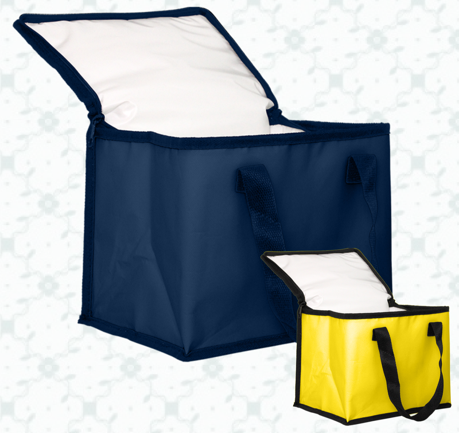
Ref : Sac polypro isolant HBSI8 25 + 20 x 20 cm Personnalisation : 1 couleur sur 1 face