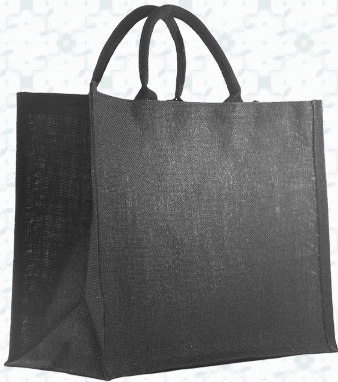
Ref : Sac toile de jute HBJ19 42 + 19 x 35 cm Personnalisation : 1 à 2 couleurs sur 1 à 2 faces