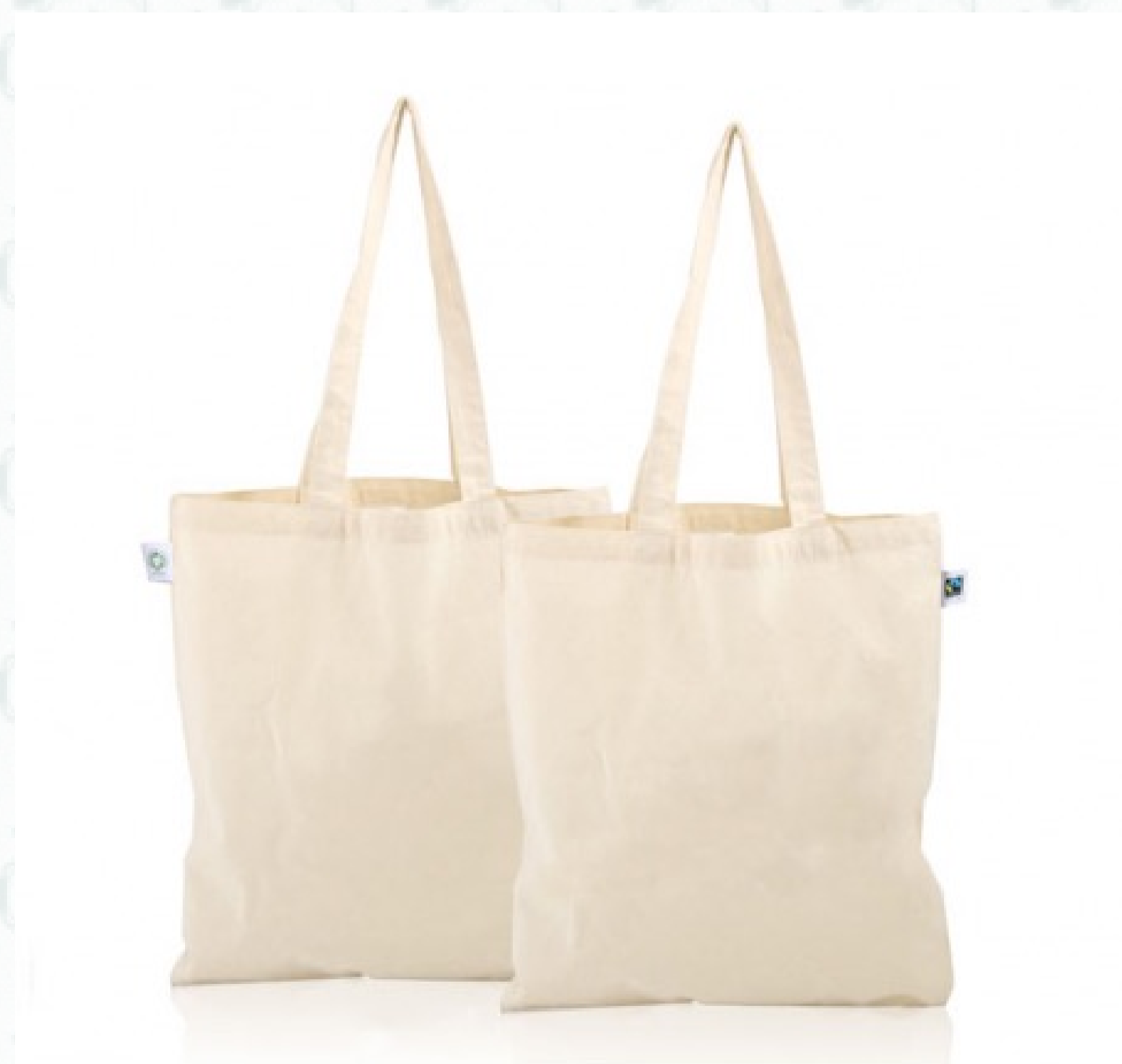
Ref : Sac coton FAIRTRADE 38 x 42 cm Personnalisation : nous contacter