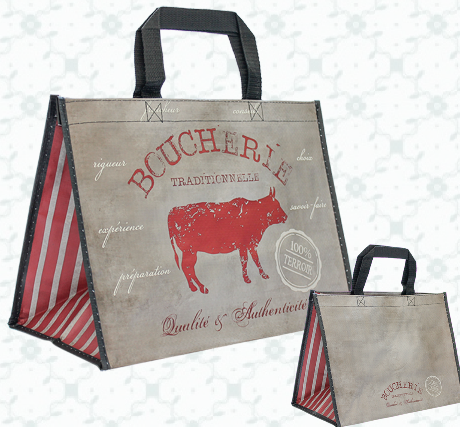
Ref : Sac polypro HBP103 36 + 20 x 27 cm Personnalisation : 1 couleur sur 1 face