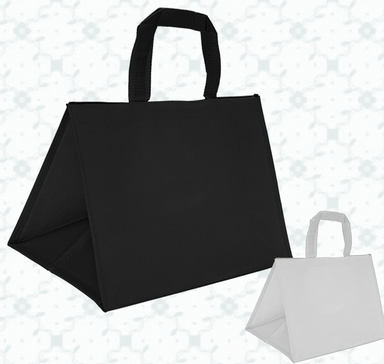
Ref : Sac polypro HBP47 36 + 30 x 27 cm - 3 coloris disponibles Personnalisation : nous contacter