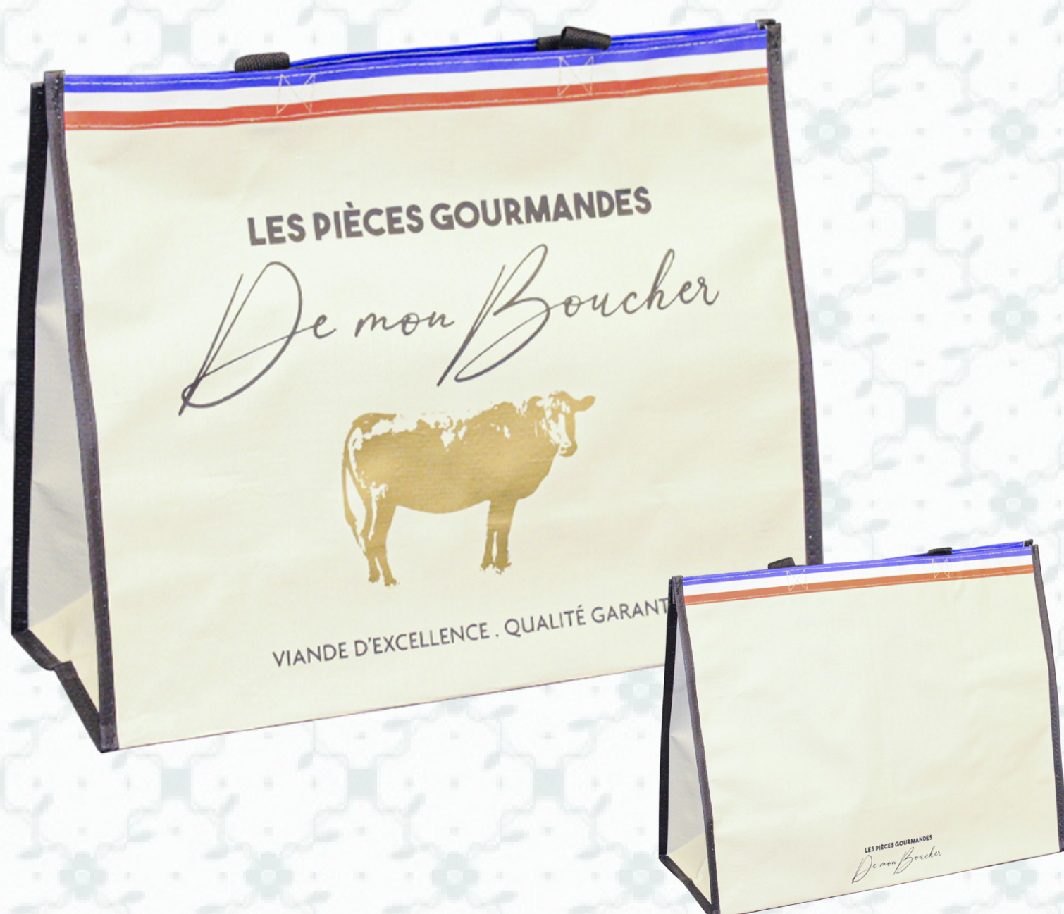
Ref : Sac polypro HBP33 42 + 19 x 35 cm Personnalisation : 1 couleur sur 1 face