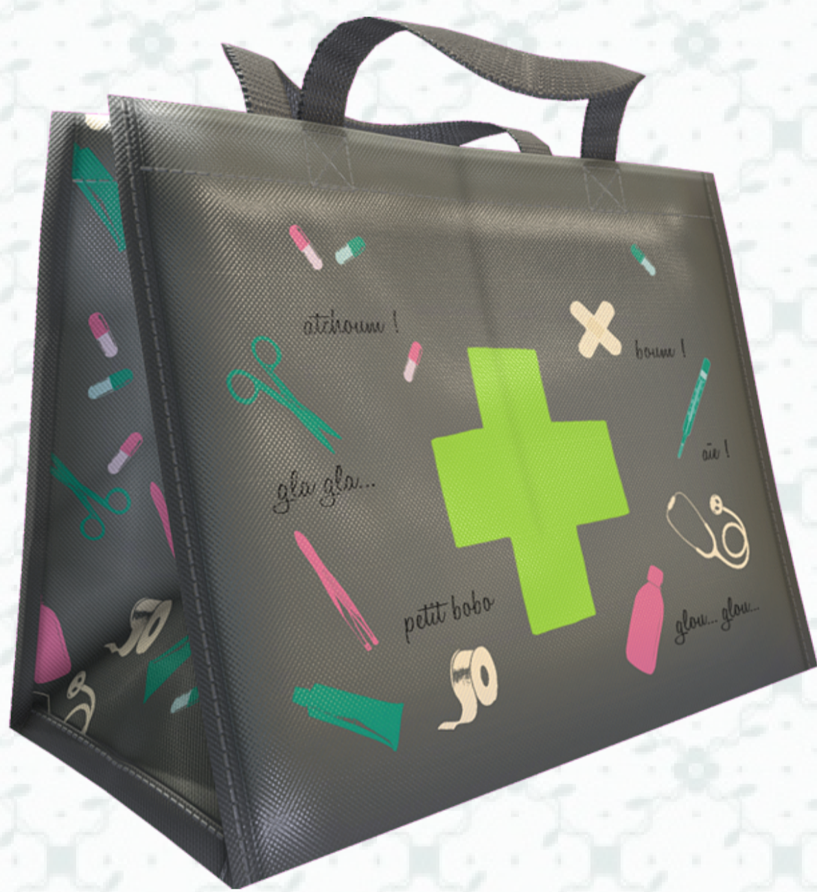
Ref : Sac polypro HBP115 36 + 20 x 27 cm Personnalisation : 1 couleur sur 1 face