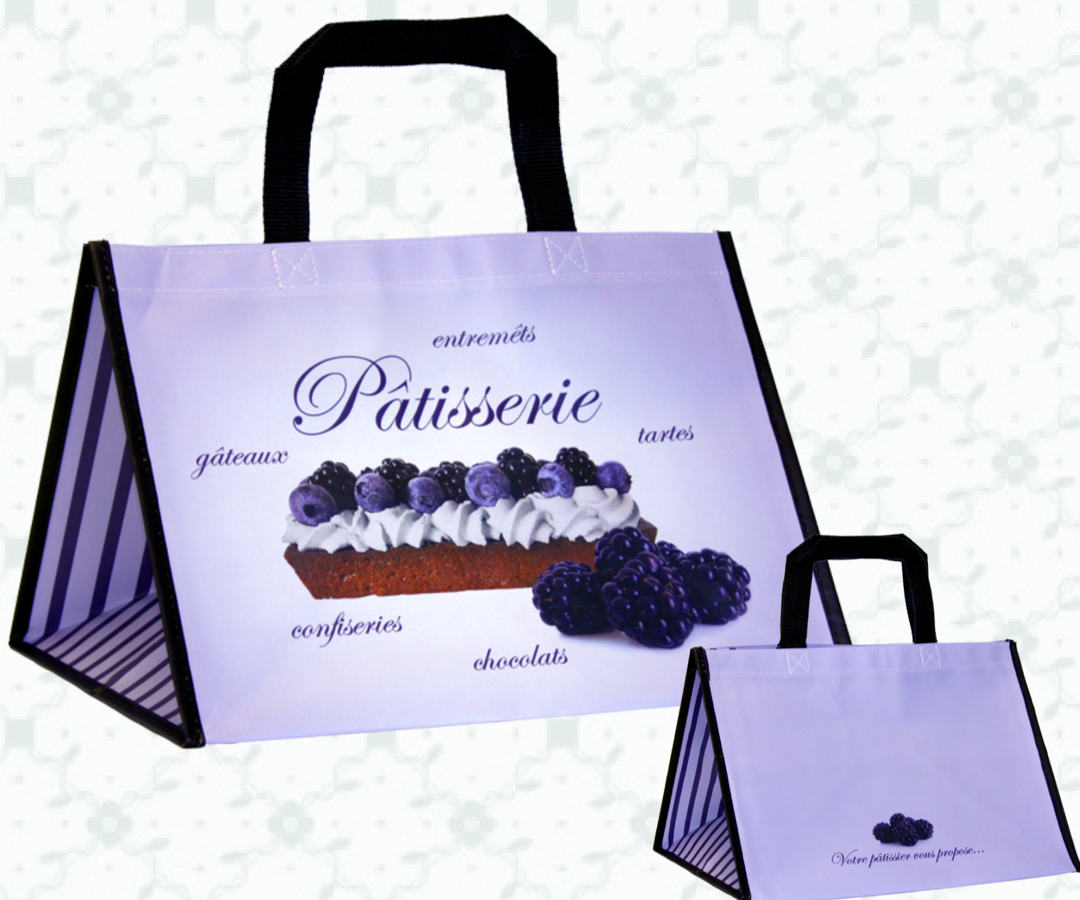
Ref : Sac polypro HBP54 36 + 30 x 27 cm Personnalisation : 1 couleur sur 1 face

Découvrez nos designs spécialement conçus pour votre activité à travers notre gamme de cabas « Boulangerie Pâtisserie ». Un gain de temps mais pas seulement, ces sacs réutilisables extrêmement résistants sont parfaits pour diffuser votre marque sur du long terme.