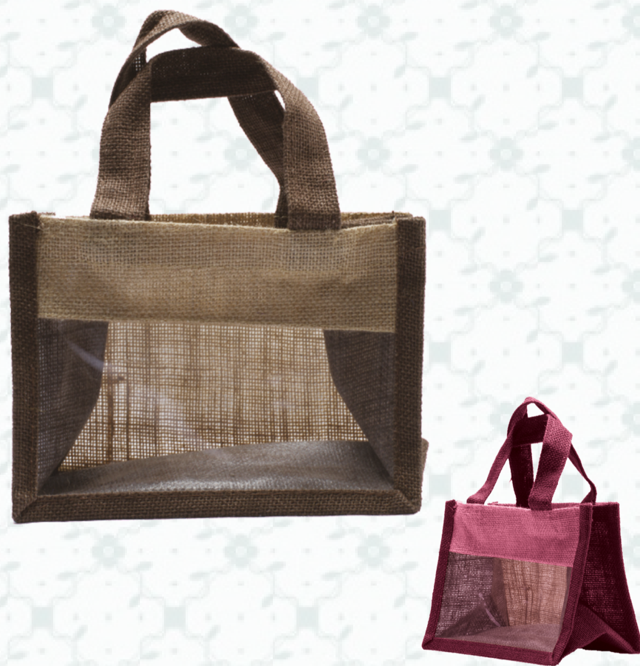
Ref : Sac toile de jute HBJ9 20 + 10 x 14 cm Personnalisation : 1 couleur sur 1 face