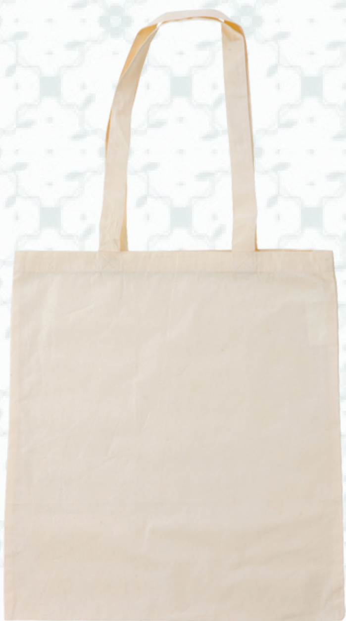
Ref : Sac coton HBC2 ÉCRU 38 x 42 cm Personnalisation : 1 à 2 couleurs sur 1 à 2 faces