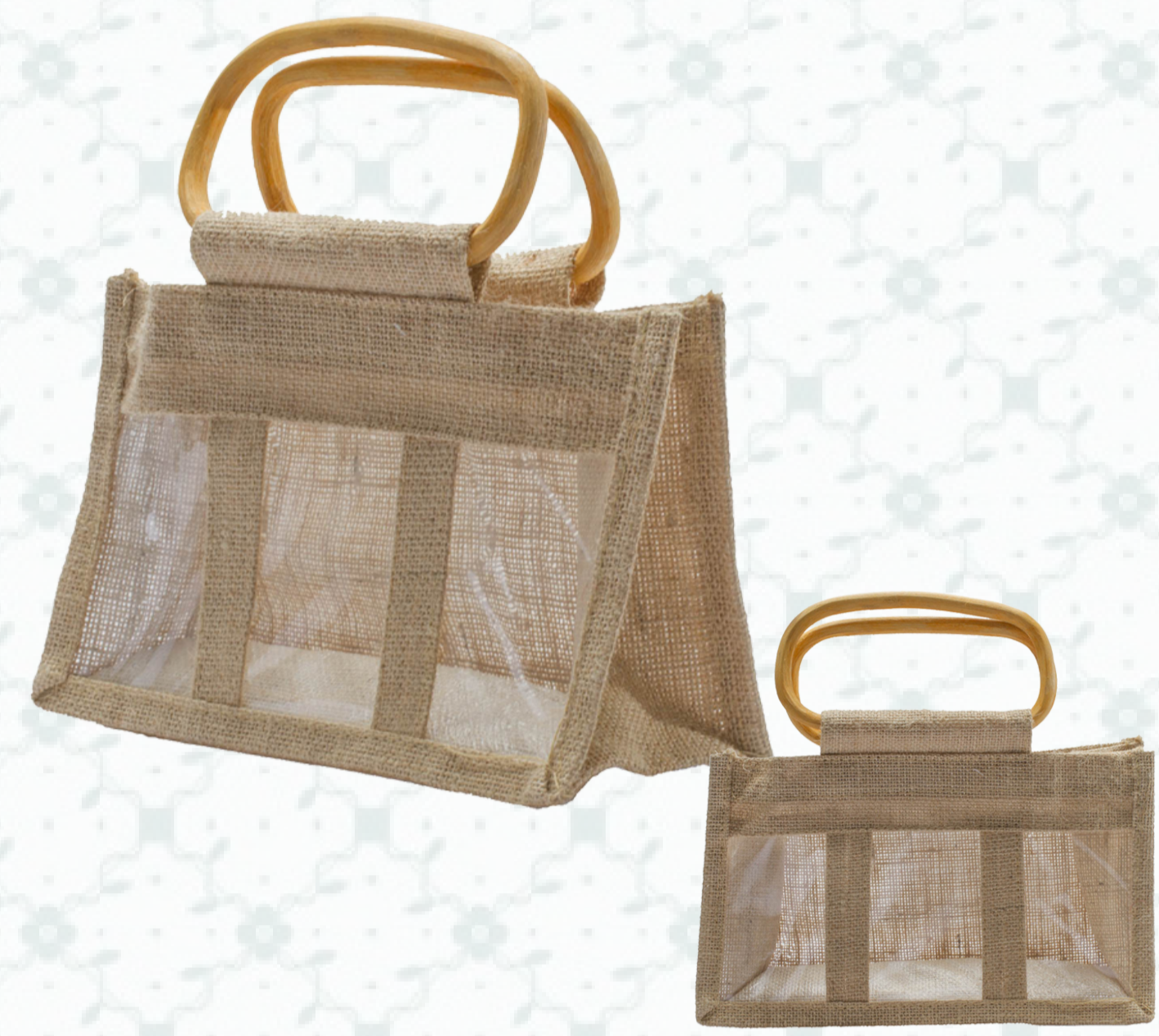
Ref : Sac toile de jute HBJ5 25 + 10 x 14 cm Personnalisation : 1 couleur sur 1 face