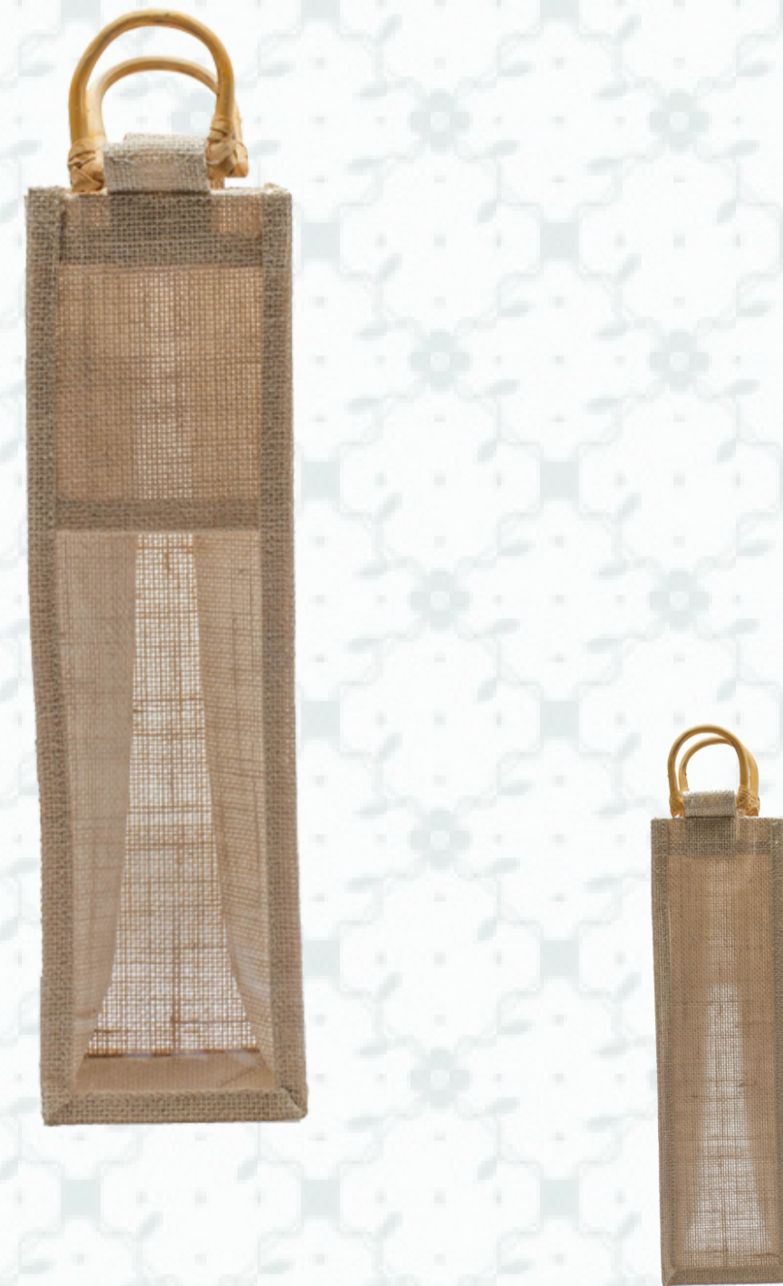
Ref : Sac 1 bouteille HBJ10 10 + 10 x 36 cm Personnalisation : 1 couleur sur 1 face