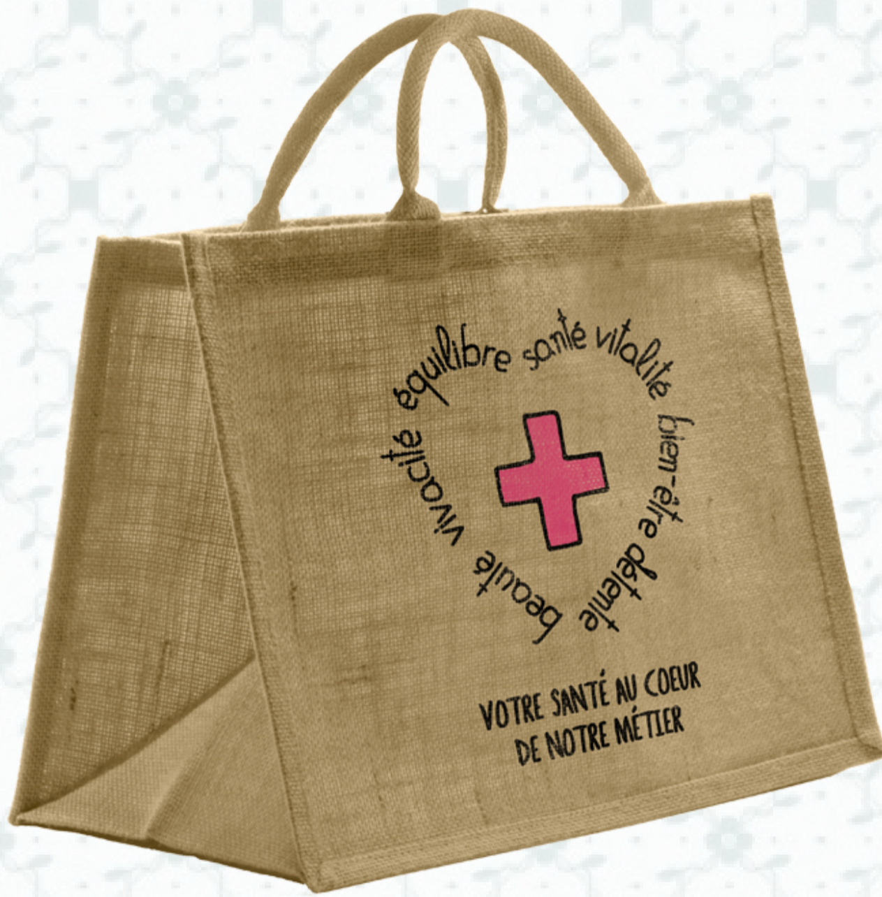
Ref : Sac toile de jute HBJ22 36 + 20 x 27 cm Personnalisation : 1 couleur sur 1 face

Découvrez nos designs spécialement conçus pour votre activité à travers notre gamme de cabas « Pharmacie ». Un gain de temps mais pas seulement, ces sacs réutilisables extrêmement résistants sont parfaits pour diffuser votre marque sur du long terme.