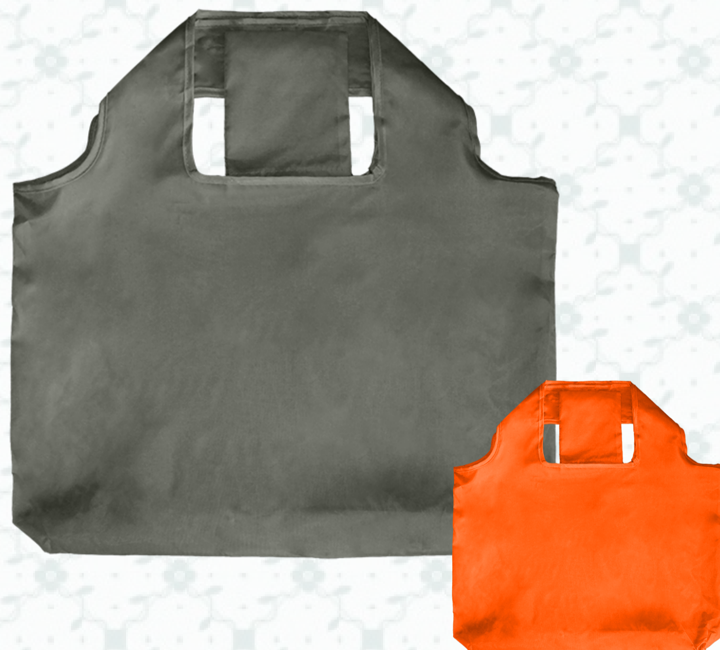
Ref : Sac Polyester HBN4 45 + 5 x 34 cm - 10 coloris disponibles Personnalisation : 1 couleur sur 1 face