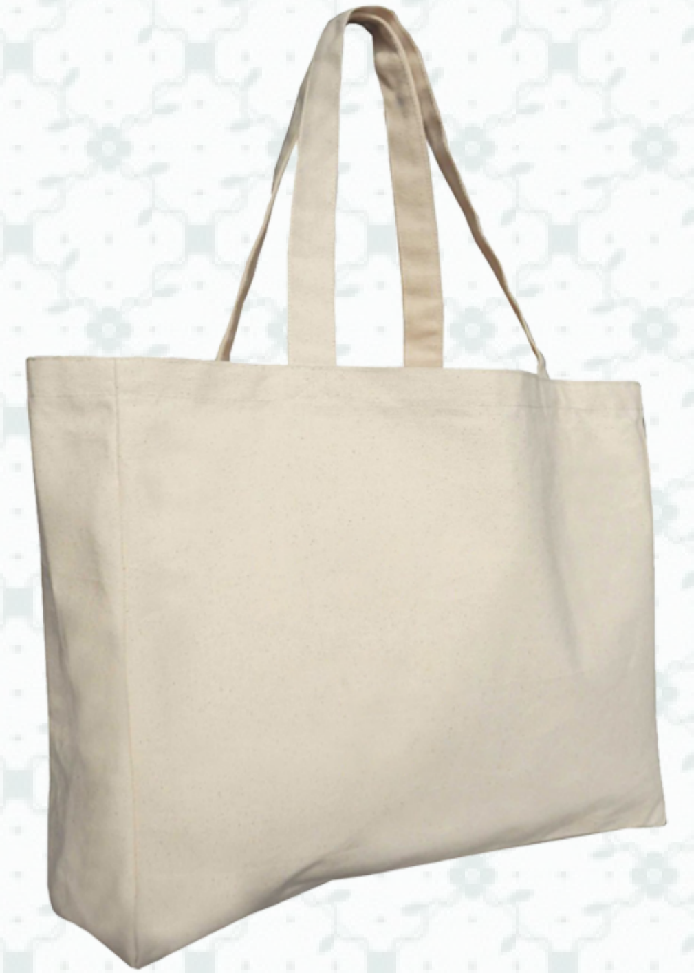
Ref : Sac coton HBC5 40+ 12 x 35 cm Personnalisation : 1 à 2 couleurs sur 1 à 2 faces