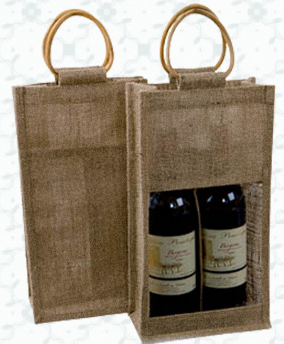
Ref : Sac 2 bouteilles HBJ11 20 + 10 x 36 cm Personnalisation : 1 couleur sur 1 face