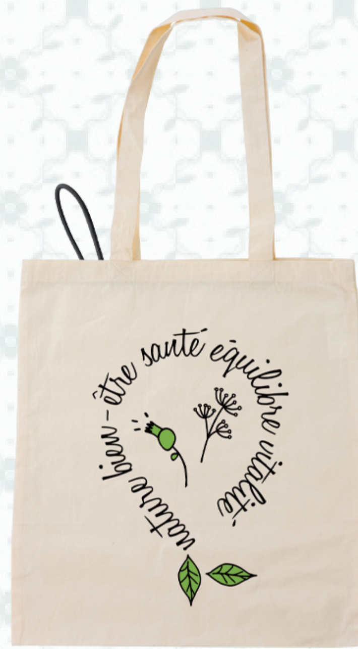
Ref : Sac coton HBC6 38 x 42 cm Personnalisation : 1 couleur sur 1 face