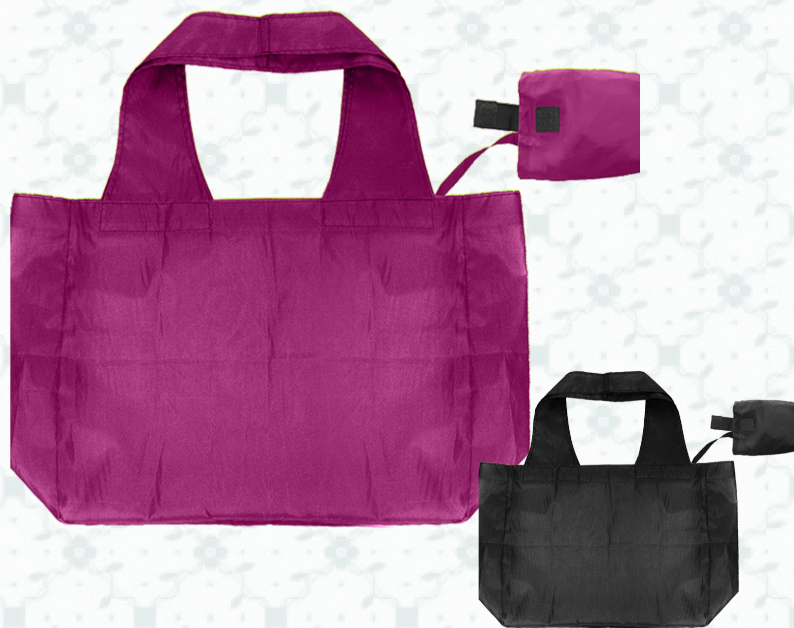
Ref : Sac Polyester HBN3 40 + 13 x 32 cm - 5 coloris disponibles Personnalisation : 1 couleur sur 1 face

Réutilisable et pratique, le sac pliable est l'objet qui facilitera le quotidien de vos clients. Sa pochette flottante permet de le ranger à tout moment et n'importe où.