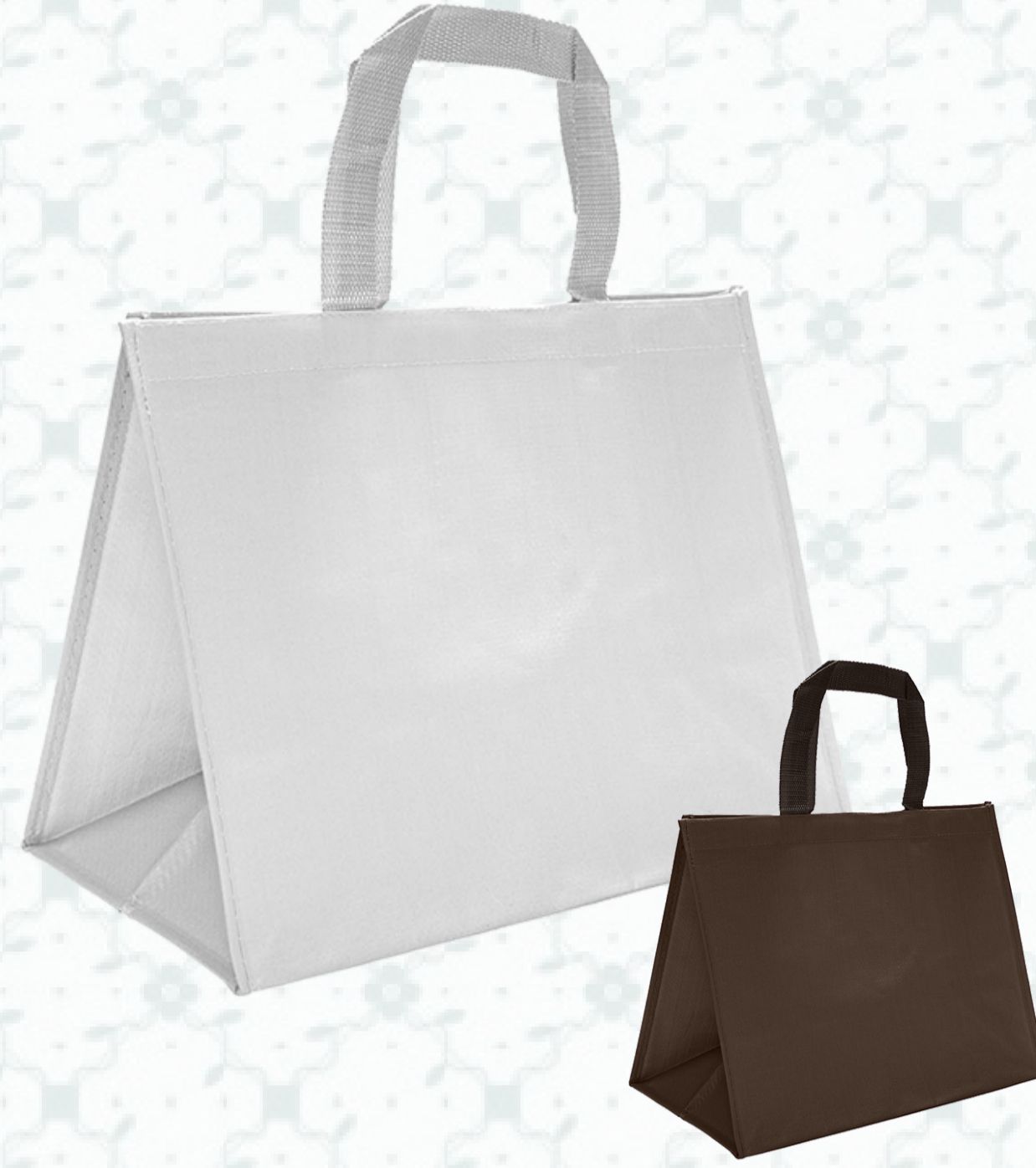
Ref : Sac polypro HBSI4 40 + 20 x 30 cm - 4 coloris disponibles Personnalisation : 1 couleur sur 1 face