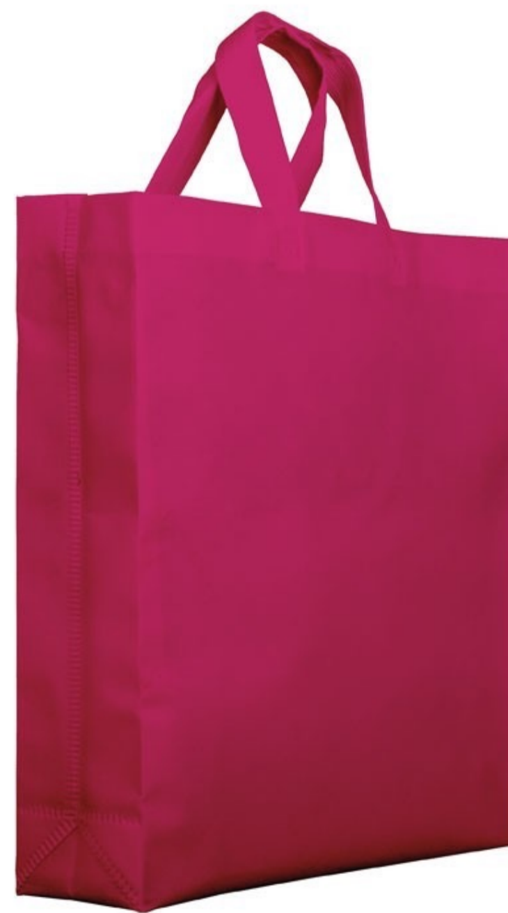
Ref : Sac polypro BOSSANOVA 38 + 10 x 40 cm - 12 coloris disponibles Personnalisation : 1 couleur sur 1 face