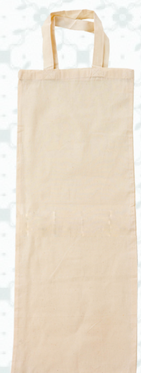
Ref : Sac coton HBSP10 25 x 65 cm Personnalisation : 1 couleur sur 1 face