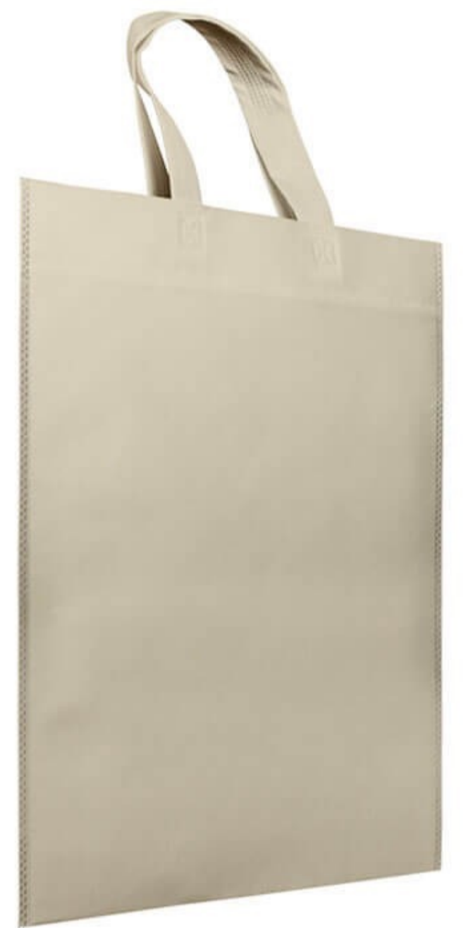
Ref : Sac polypro MAMBO 38 X 42 cm - 13 coloris disponibles Personnalisation : 1 couleur sur 1 face