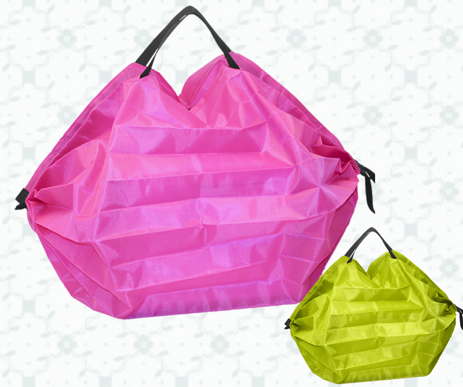
Ref : Sac Polyester HBN11 40 x 40 cm Personnalisation : 1 couleur sur 1 face