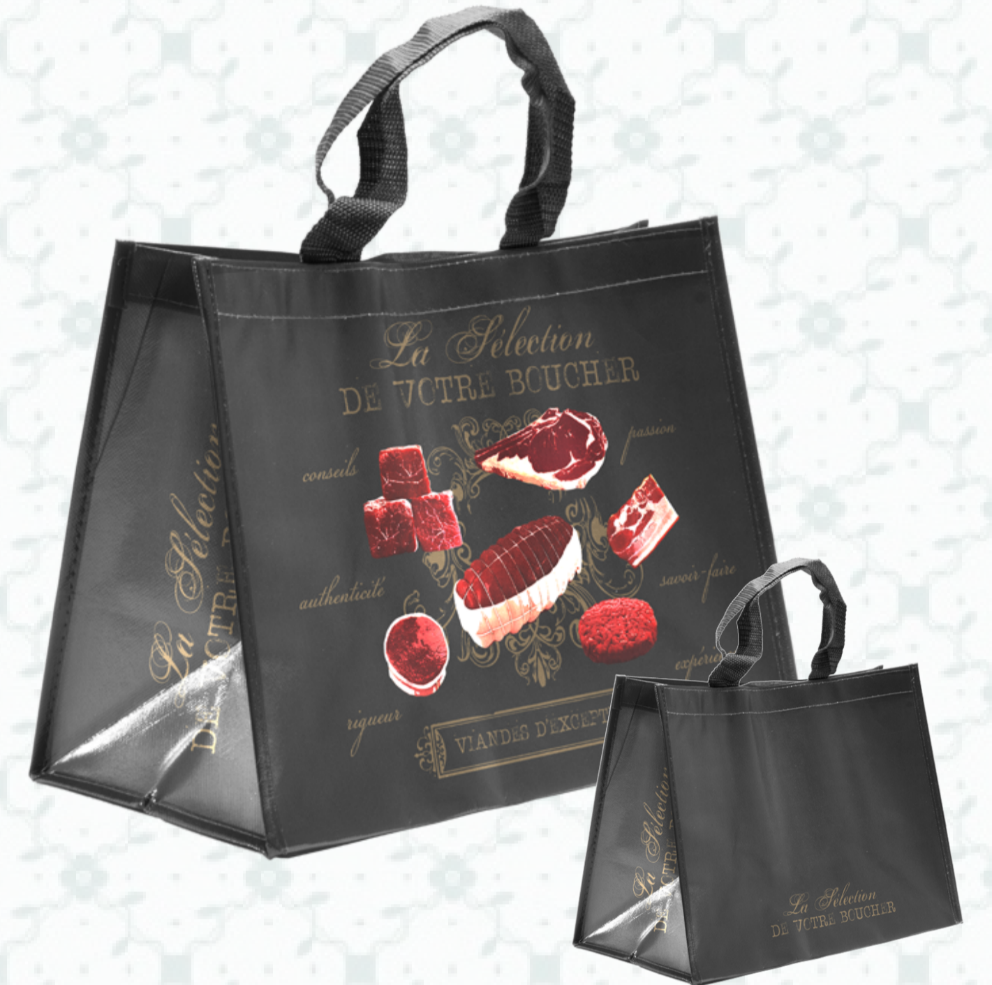
Ref : Sac polypro HBP108 36 + 20 x 27 cm Personnalisation : 1 couleur sur 1 face