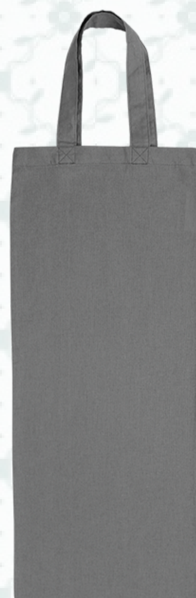
Ref : Sac coton HBSP6 25 x 60 cm Personnalisation : 1 couleur sur 1 face