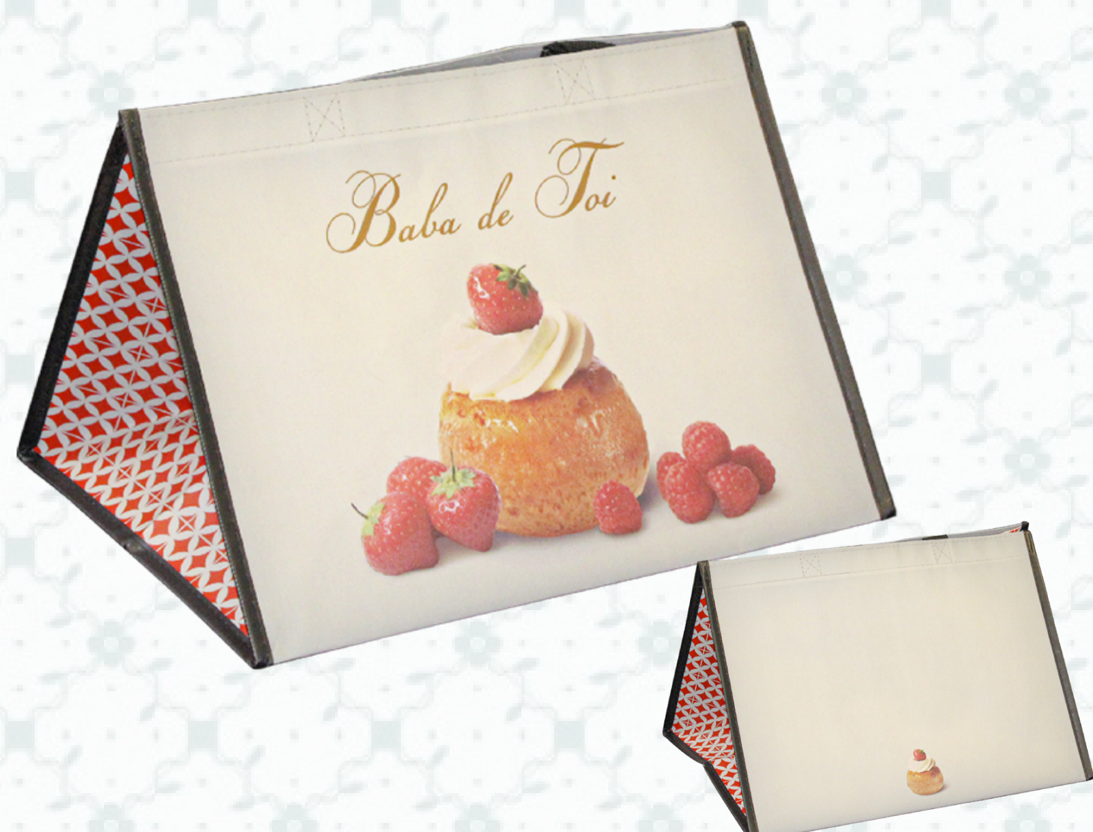
Ref : Sac polypro HBP57 36 + 30 x 27 cm Personnalisation : 1 couleur sur 1 face