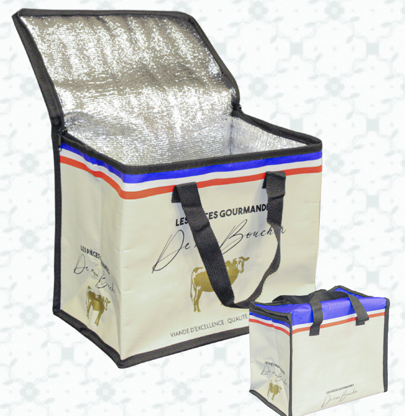
Ref : Sac polypro isolant HBSI10 30 + 20 x 25 cm Personnalisation : 1 couleur sur 1 face