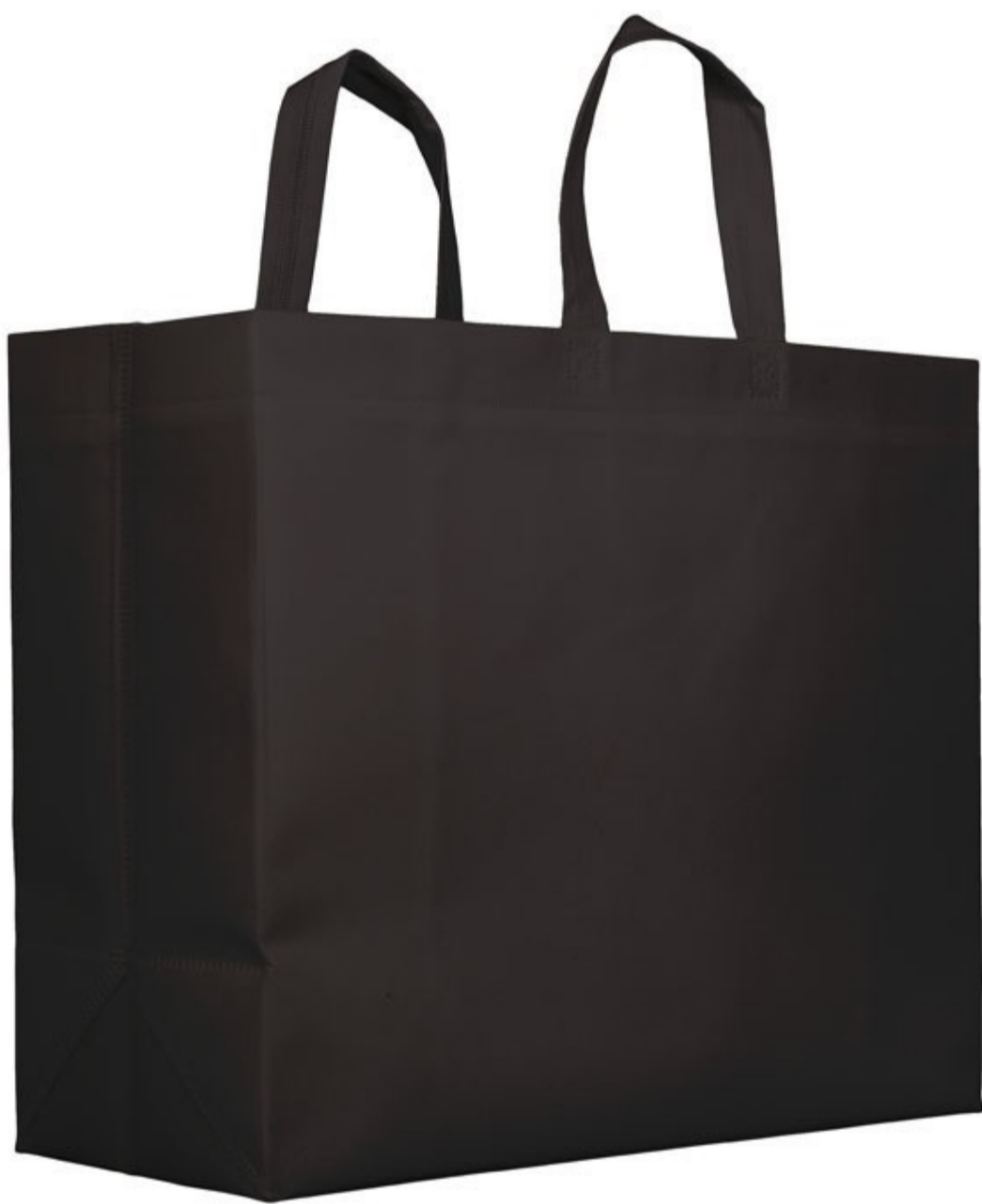
Ref : Sac polypro MARIACHI 45 + 20 x 40 cm - 6 coloris disponibles Personnalisation : 1 couleur sur 1 face