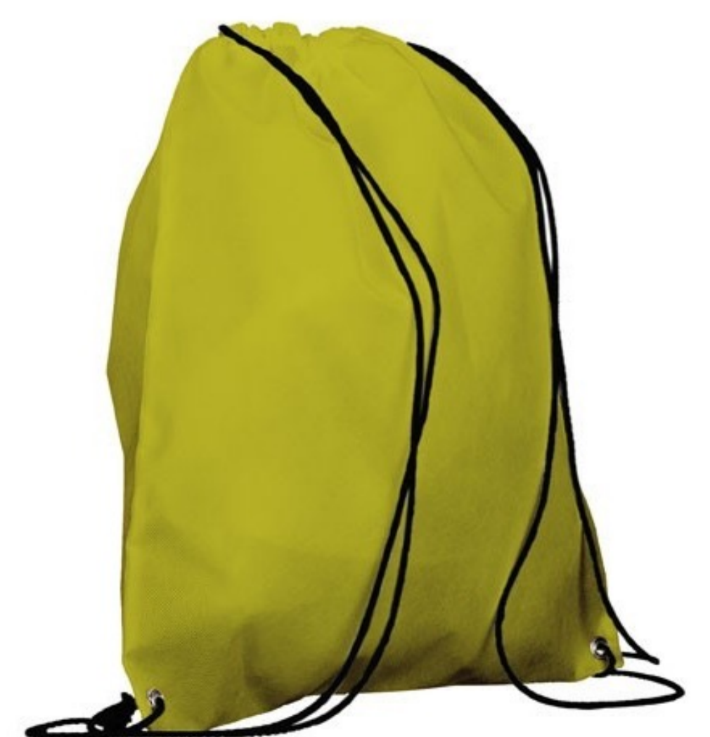
Ref : Sac polypro REGGAE 36 x 42 cm Personnalisation : 1 couleur sur 1 face