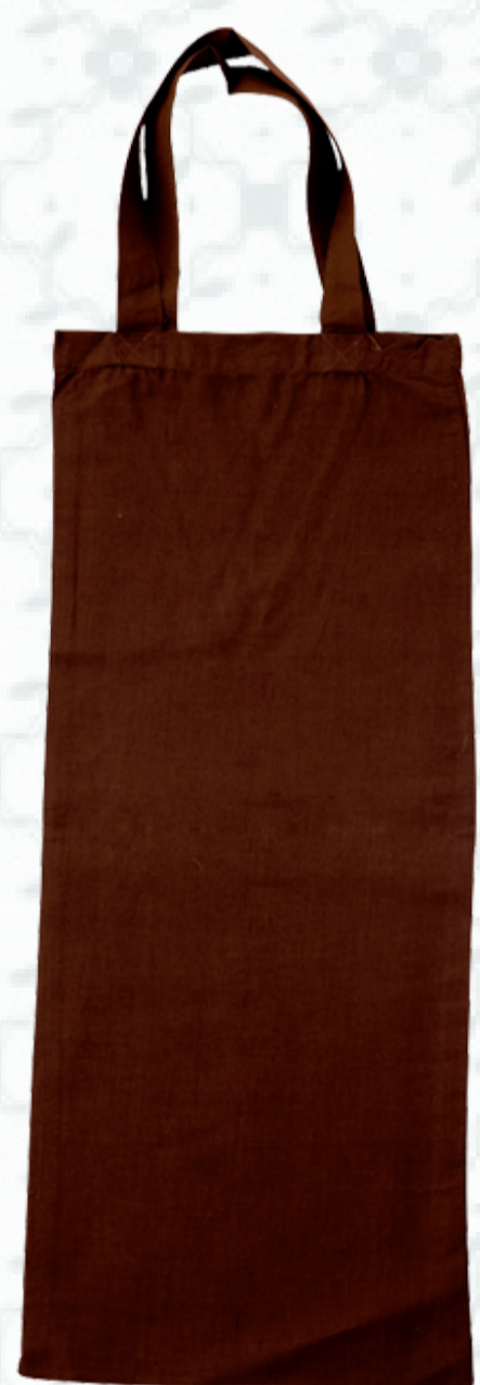
Ref : Sac coton HBSP6 25 x 60 cm Personnalisation : 1 couleur sur 1 face