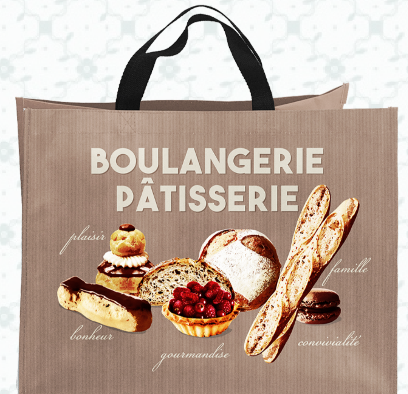
Ref : Sac polypro HBP56 45 + 30 x 35 cm Personnalisation : 1 couleur sur 1 face