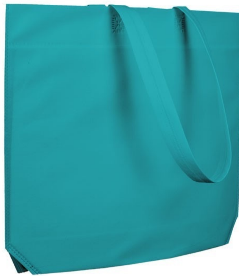
Ref : Sac polypro CALYPSO 48 + 10 x 35 cm - 13 coloris disponibles Personnalisation : 1 couleur sur 1 face