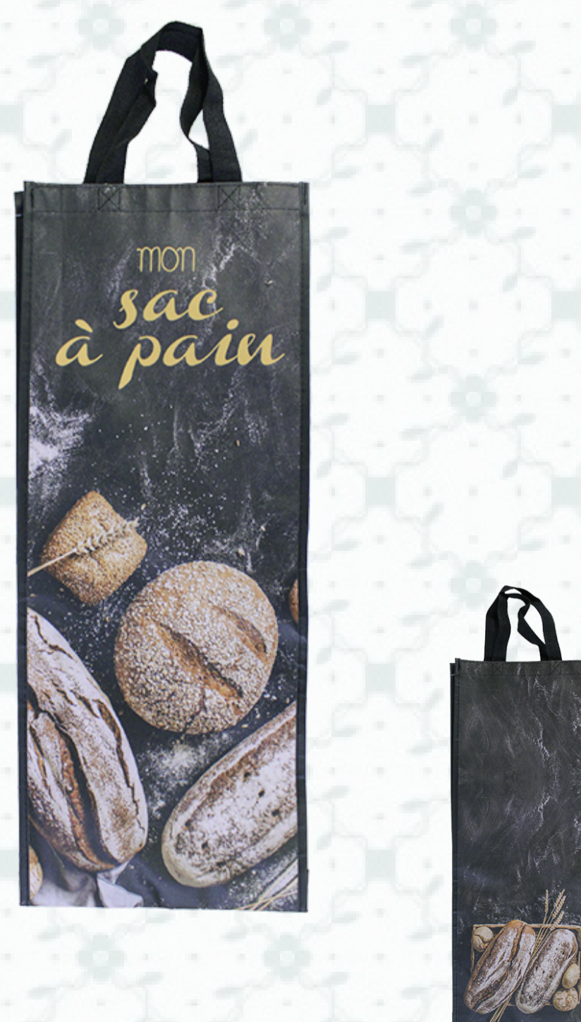
Ref : Sac polypro HBSP11 25 + 8 x 65 cm Personnalisation : 1 couleur sur 1 face