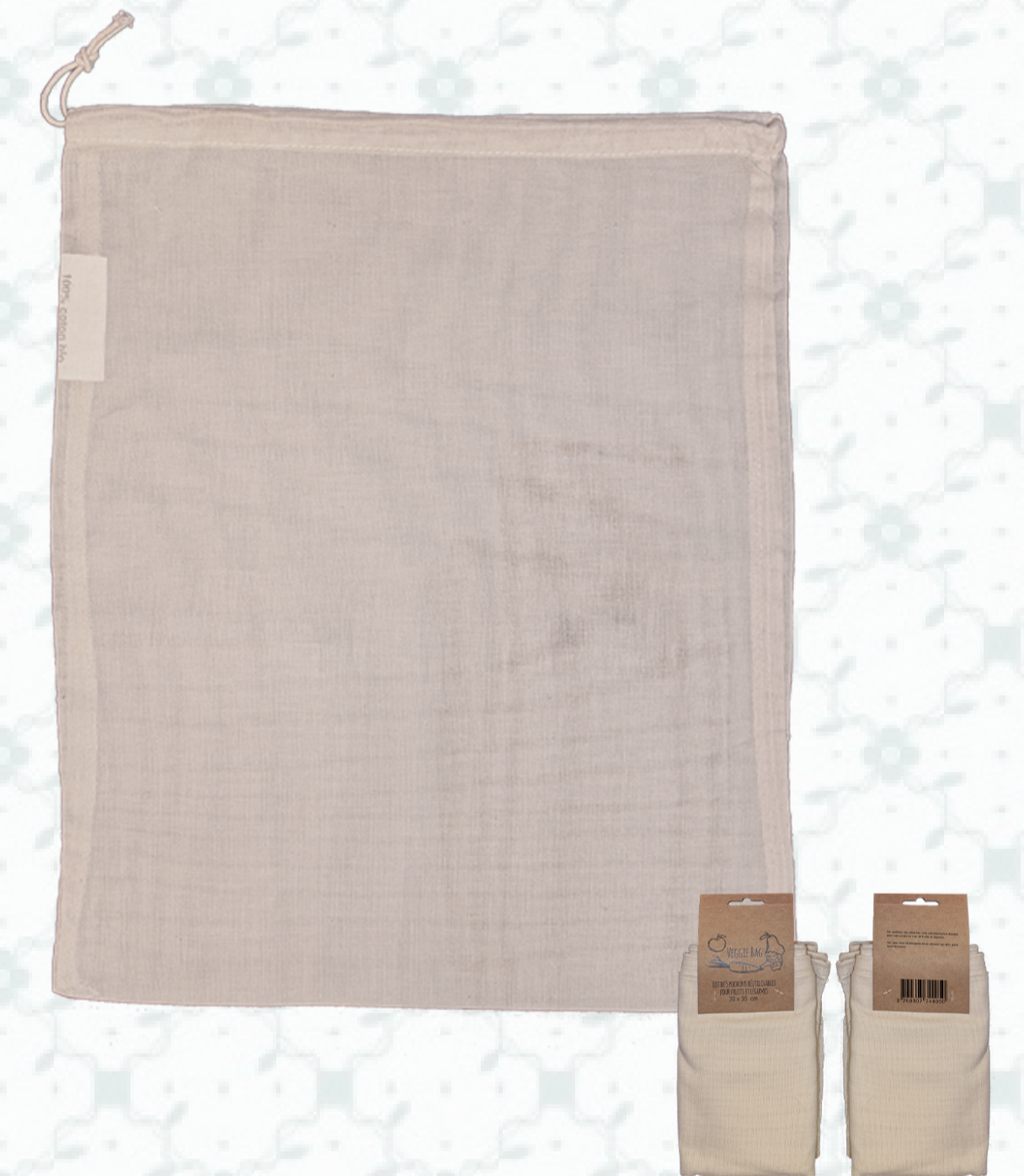
Ref : Sac veggie bag HBVB3 30 x 35 cm Aucune personnalisation