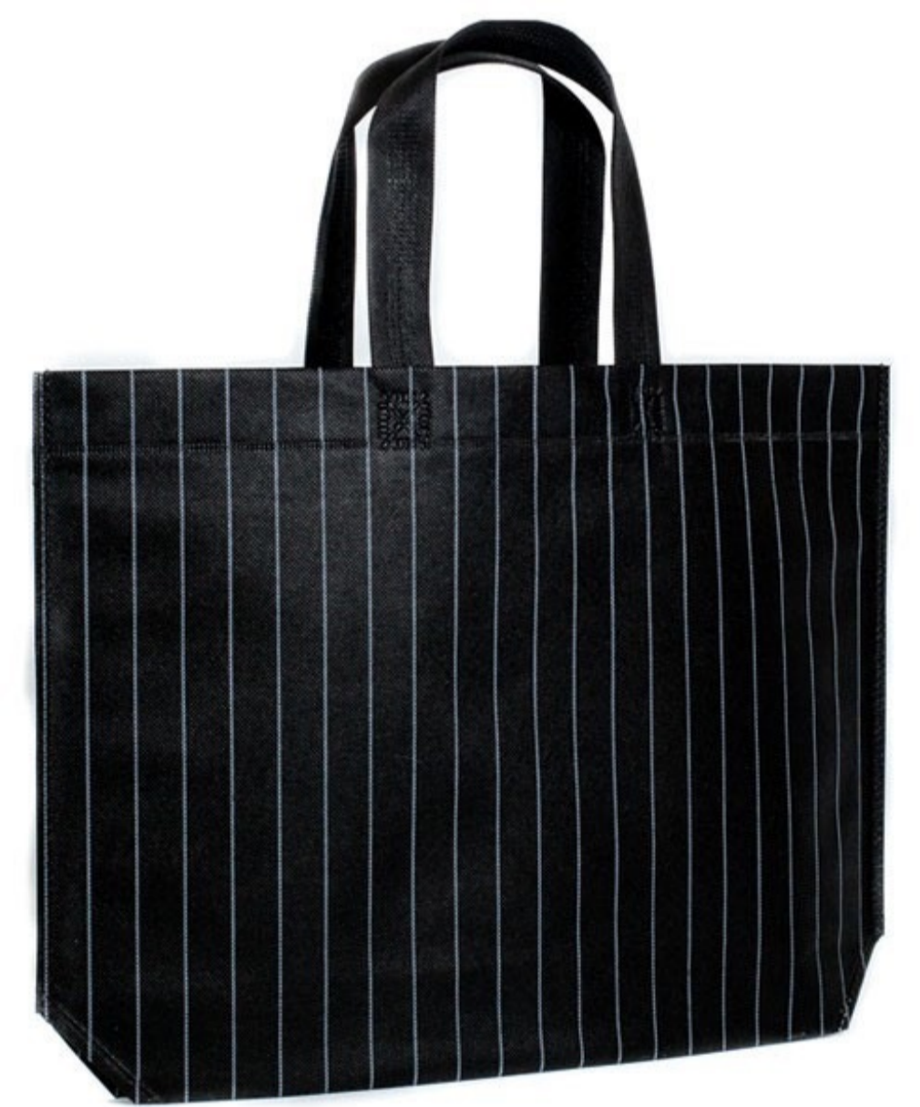
Ref : Sac polypro DIPLOMATIC X 44 + 10 x 30 cm Personnalisation : 1 couleur sur 1 face