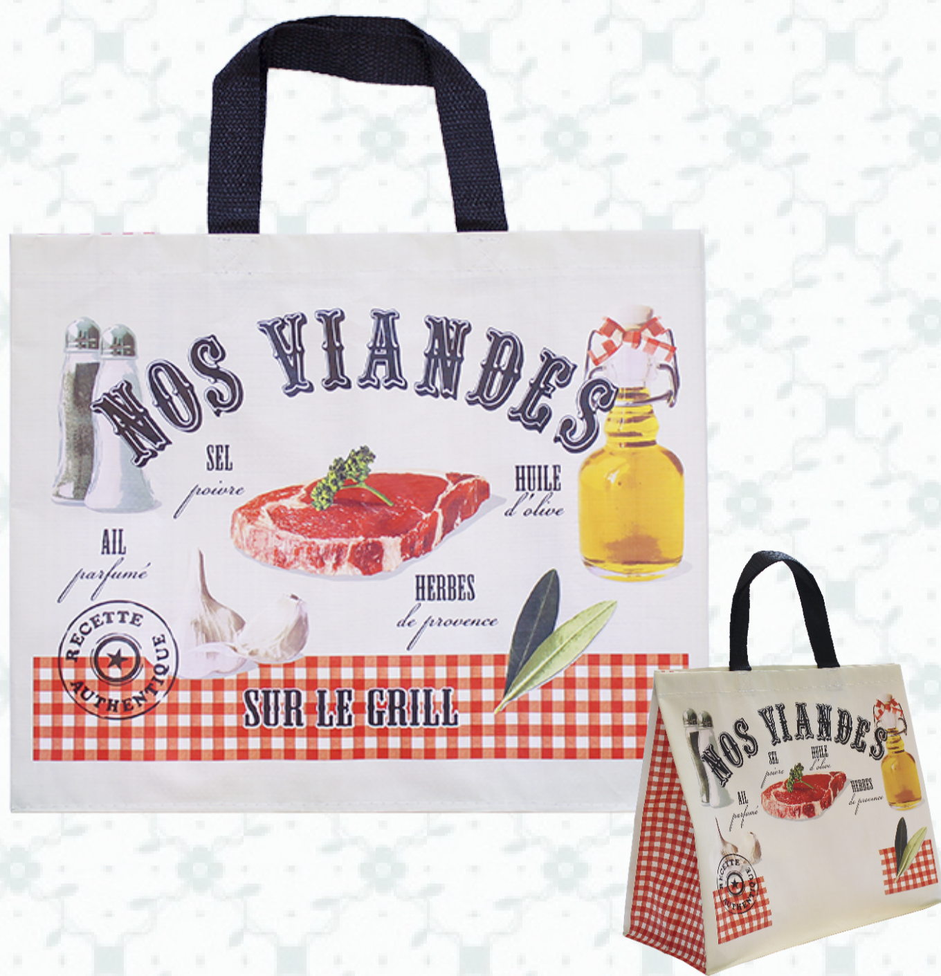
Ref : Sac polypro HBP97 42 + 19 x 35 cm Personnalisation : 1 couleur sur 1 face

Découvrez nos designs spécialement conçus pour votre activité à travers notre gamme de cabas « Boucherie ». Un gain de temps mais pas seulement, ces sacs réutilisables extrêmement résistants sont parfaits pour diffuser votre marque sur du long terme.