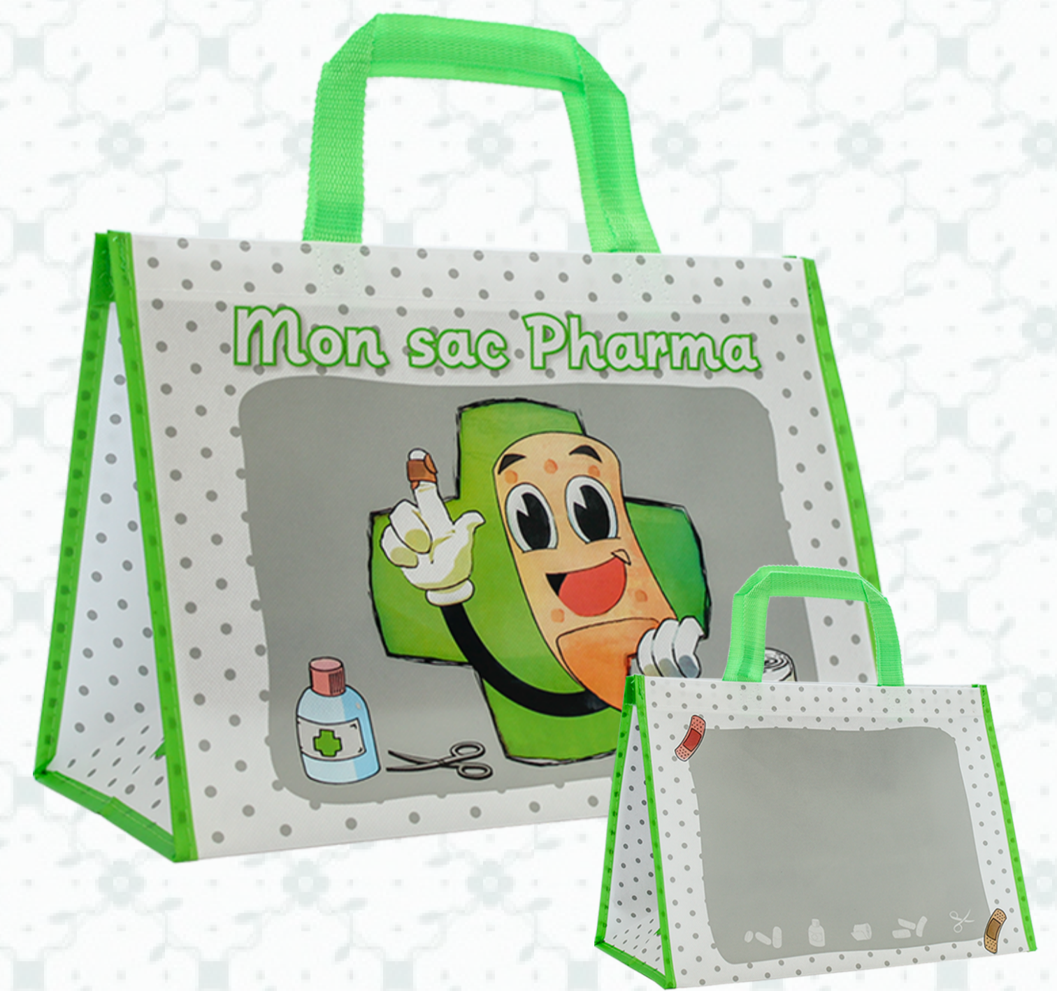
Ref : Sac polypro HBP104 36 + 20 x 27 cm Personnalisation : 1 couleur sur 1 face