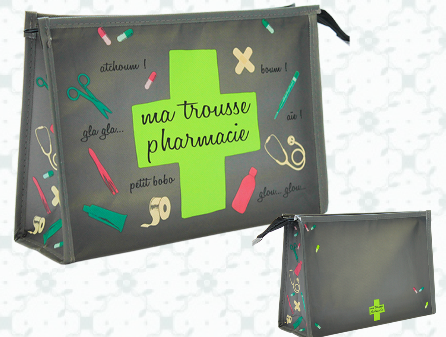
Ref : Sac polypro HBP106 30 + 10 x 20 cm Personnalisation : 1 couleur sur 1 face