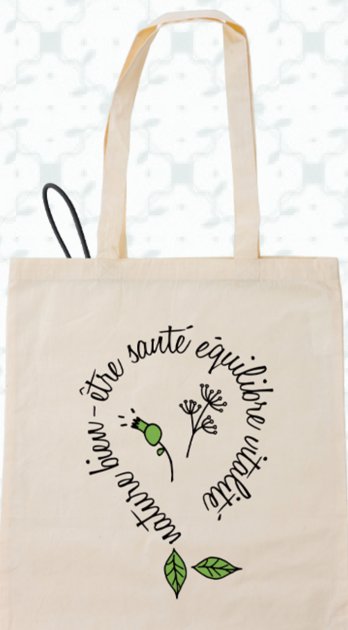
Ref : Sac coton HBC6 38 x 42 cm Personnalisation : 1 couleur sur 1 face