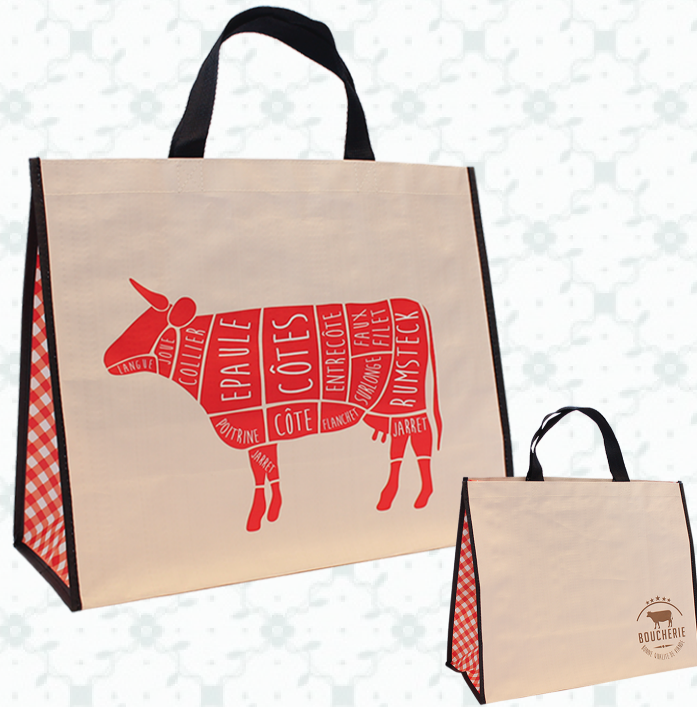
Ref : Sac polypro HBP101 42 + 19 x 35 cm Personnalisation : 1 couleur sur 1 face