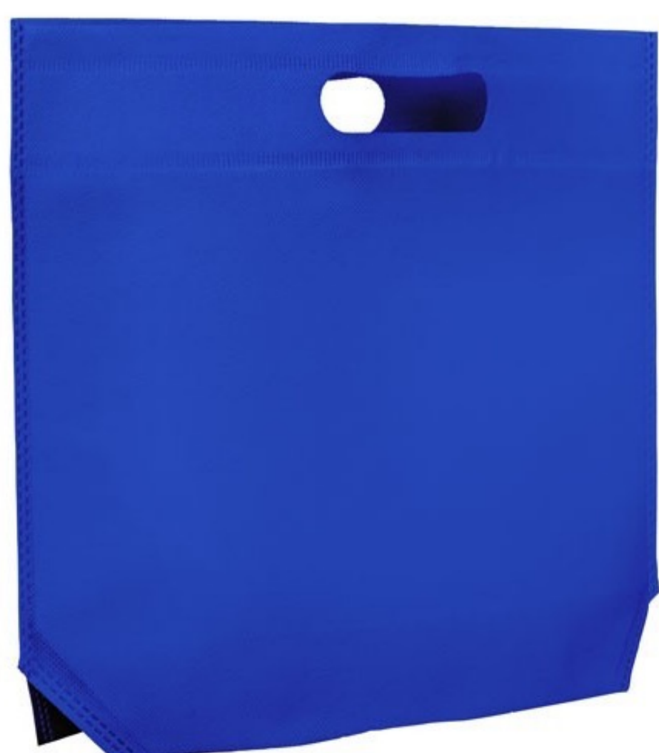
Ref : Sac polypro BOLERO 34 + 8 x 26 cm - 9 coloris disponibles Personnalisation : 1 couleur sur 1 face