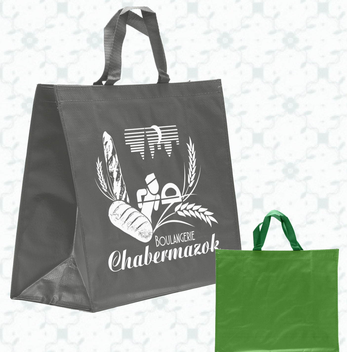
Ref : Sac polypro HBP28 42 + 19 x 35 cm - 6 coloris disponibles Personnalisation : nous contacter