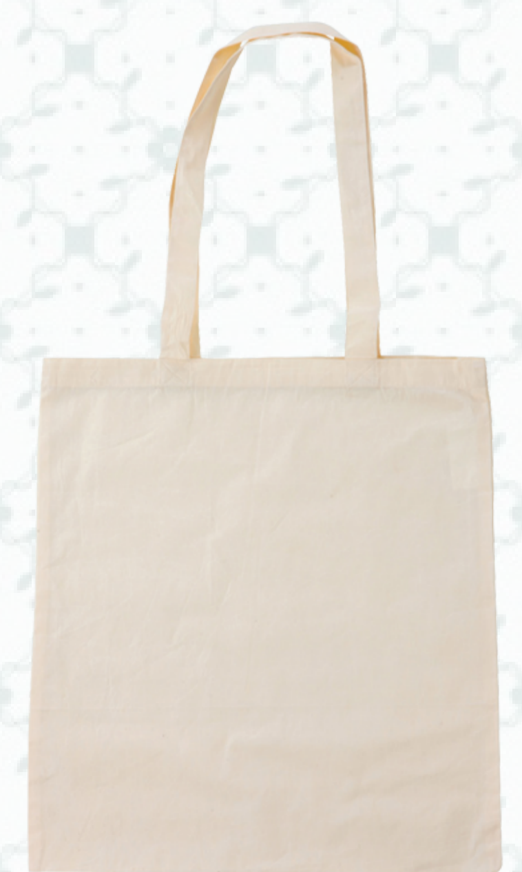
Ref : Sac coton HBC2 BIO 36 + 20 x 27 cm Personnalisation : 1 à 2 couleurs sur 1 à 2 faces