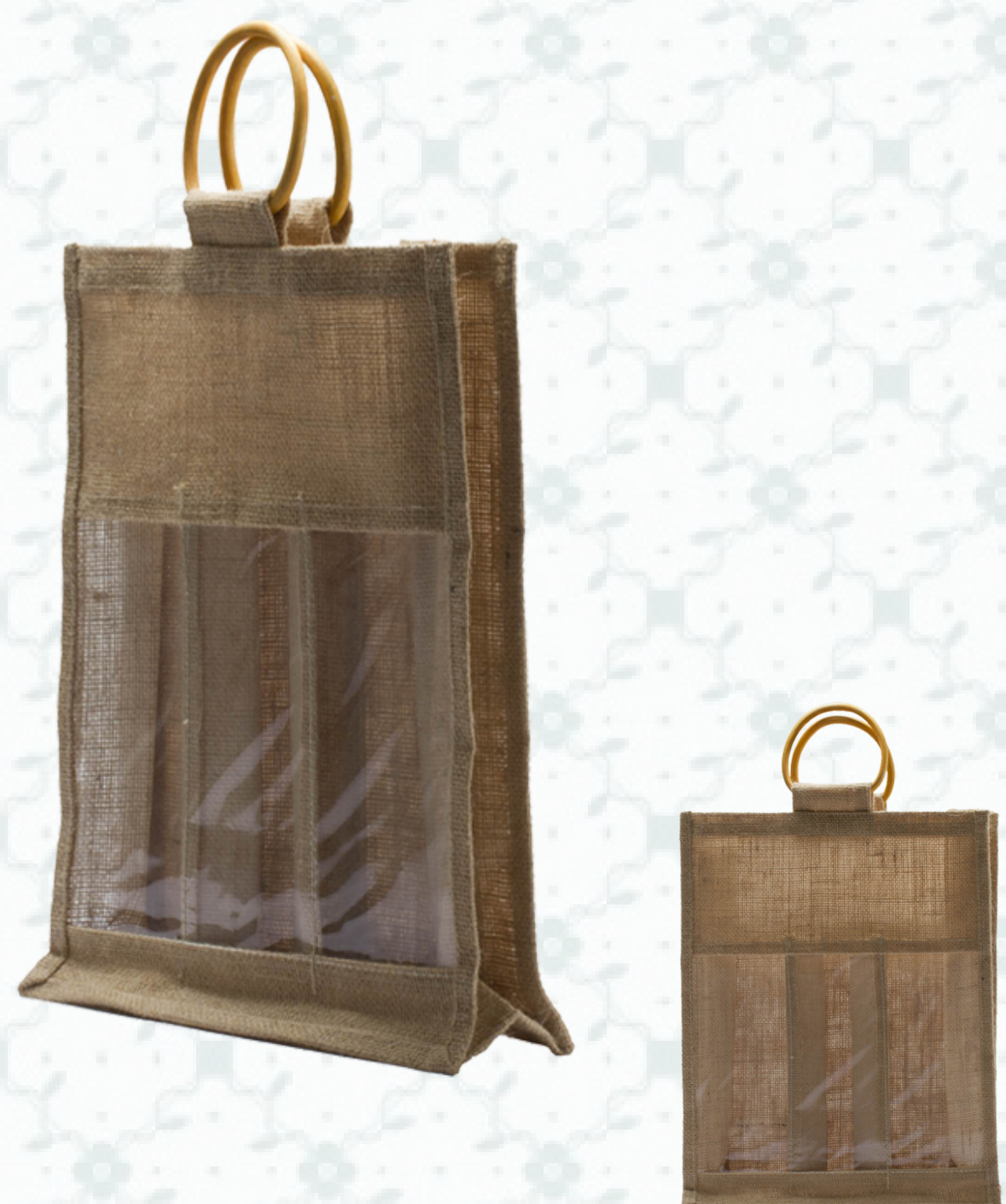
Ref : Sac 3 bouteilles HBJ12 28 + 10 x 36 cm Personnalisation : 1 couleur sur 1 face