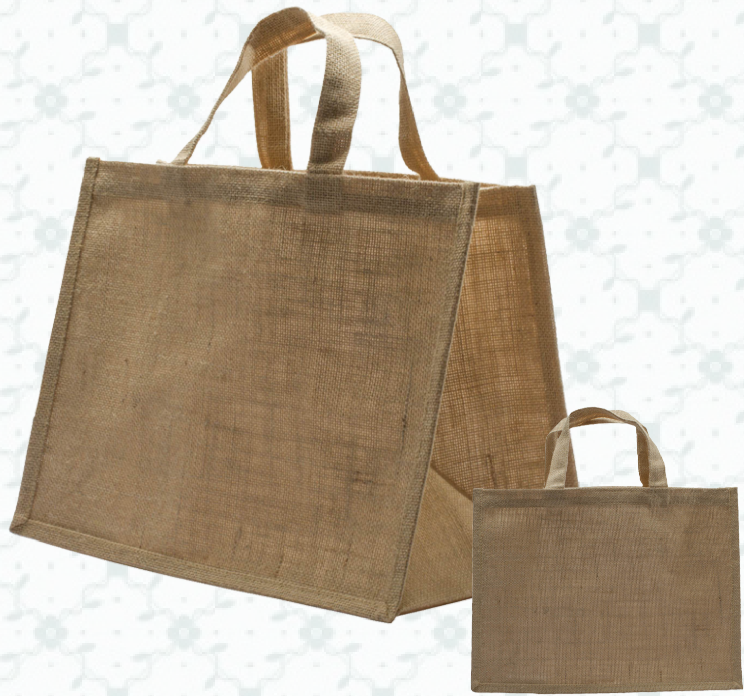
Ref : Sac toile de jute HBJ3 36 + 20 x 27 cm Personnalisation : 1 à 2 couleurs sur 1 à 2 faces

Offrez-vous le cachet d'un sac en toile de jute naturelle, qui vous offre une durabilité et une résistance accrues. Ces sacs réutilisables et personnalisables vous permettront de réaliser une communication durable et authentique.