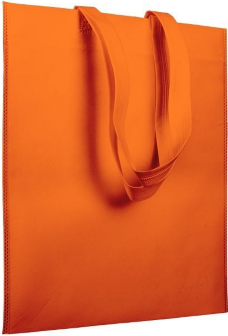
Ref : Sac polypro JAZZ 38 x 42 cm - 13 coloris disponibles Personnalisation : 1 couleur sur 1 face

Les sacs cabas en polypropylène non-tissé sont réutilisables et recyclables . En optant pour ce modèle, vous apportez esthétique et dynamisme à votre enseigne. Sa résistance, sa légèreté et son prix attractif en font un produit idéal pour votre enseigne.