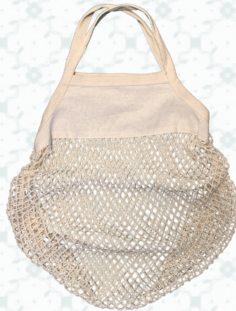
Ref : Sac filet coton HBSF1 37 x 50 cm Personnalisation : 1 couleur sur 1 face