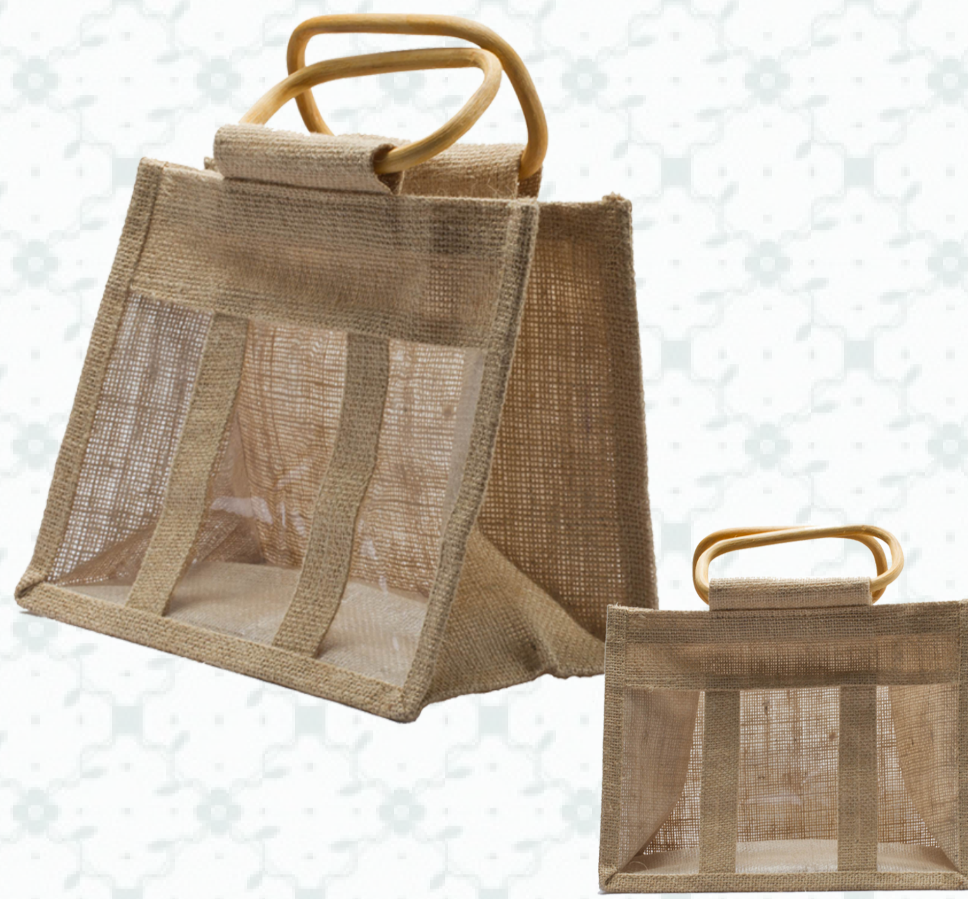
Ref : Sac toile de jute HBJ4 26 + 16 x 20 cm Personnalisation : 1 couleur sur 1 face