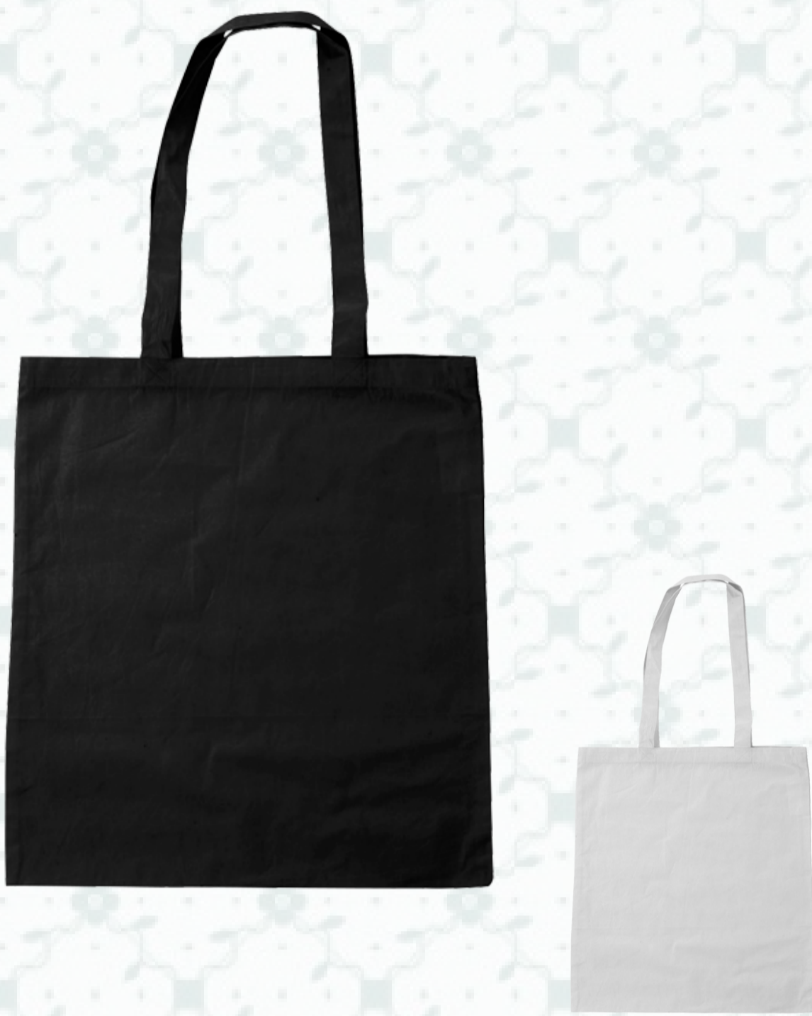
Ref : Sac coton HBC2 COULEUR 38 x 42 cm - 2 coloris disponibles Personnalisation : 1 à 2 couleurs sur 1 à 2 faces

Véritable matière 100% naturelle, le coton offre à vos sacs une durabilité et une résistance accrues. Ces sacs peuvent être en coton bio ou avec un label Fairtrade , ce qui vous permettra d'opter pour une communication à vocation responsable. Le sac en coton, aussi appelé « tote bag », est le sac publicitaire en vogue !