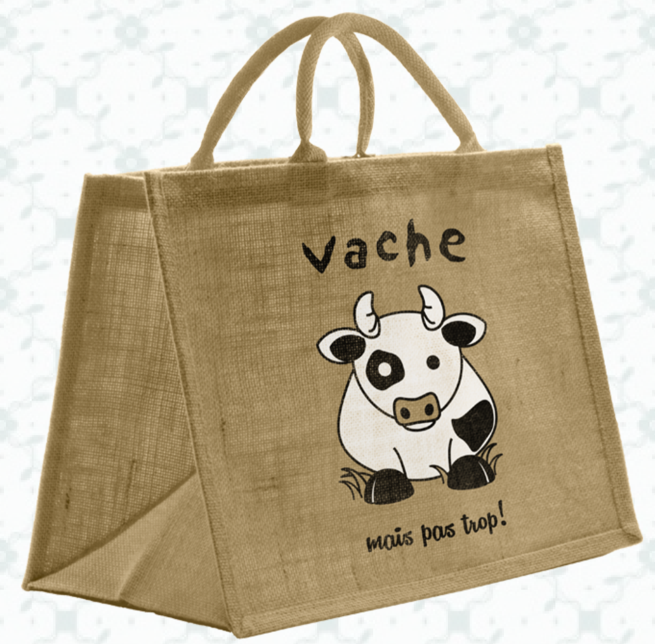
Ref : Sac toile de jute HBJ21 36 + 20 x 27 cm Personnalisation : 1 à 2 couleurs sur 1 face