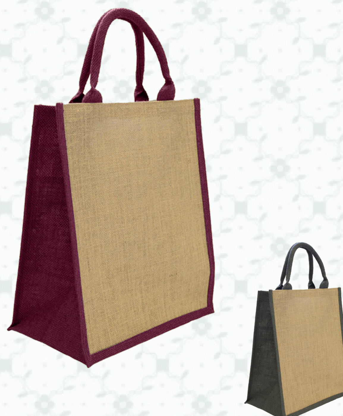
Ref : Sac toile de jute HBJ13 30 + 19 x 35 cm - 6 coloris disponibles Personnalisation : 1 à 2 couleurs sur 1 à 2 faces