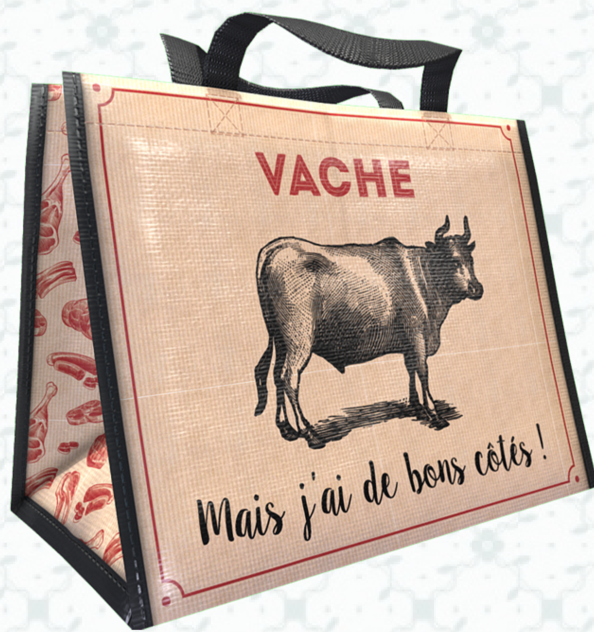
Ref : Sac polypro HBP120 36 + 20 x 27 cm Personnalisation : 1 couleur sur 1 face