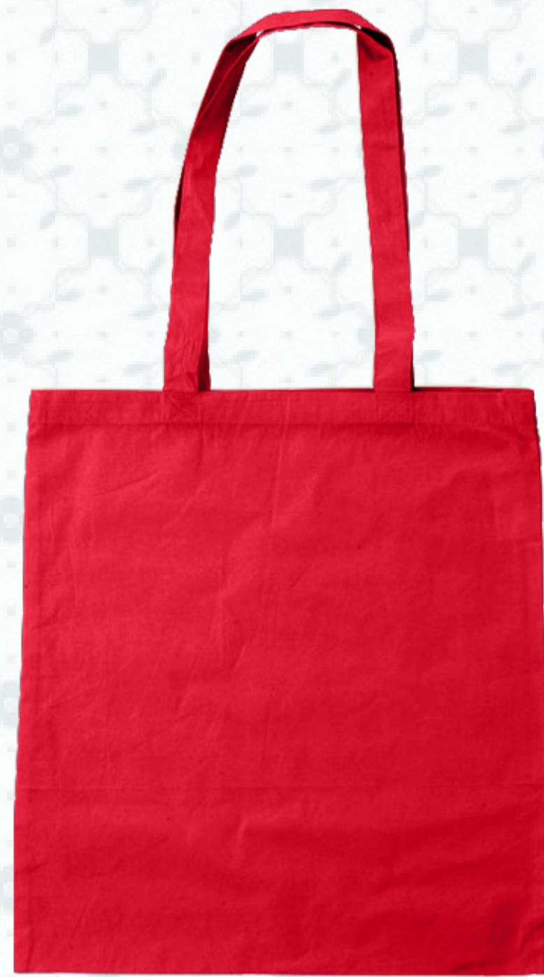
Ref : Sac coton HBC4 38 x 42 cm - 2 coloris disponibles Personnalisation : 1 à 2 couleurs sur 1 à 2 faces