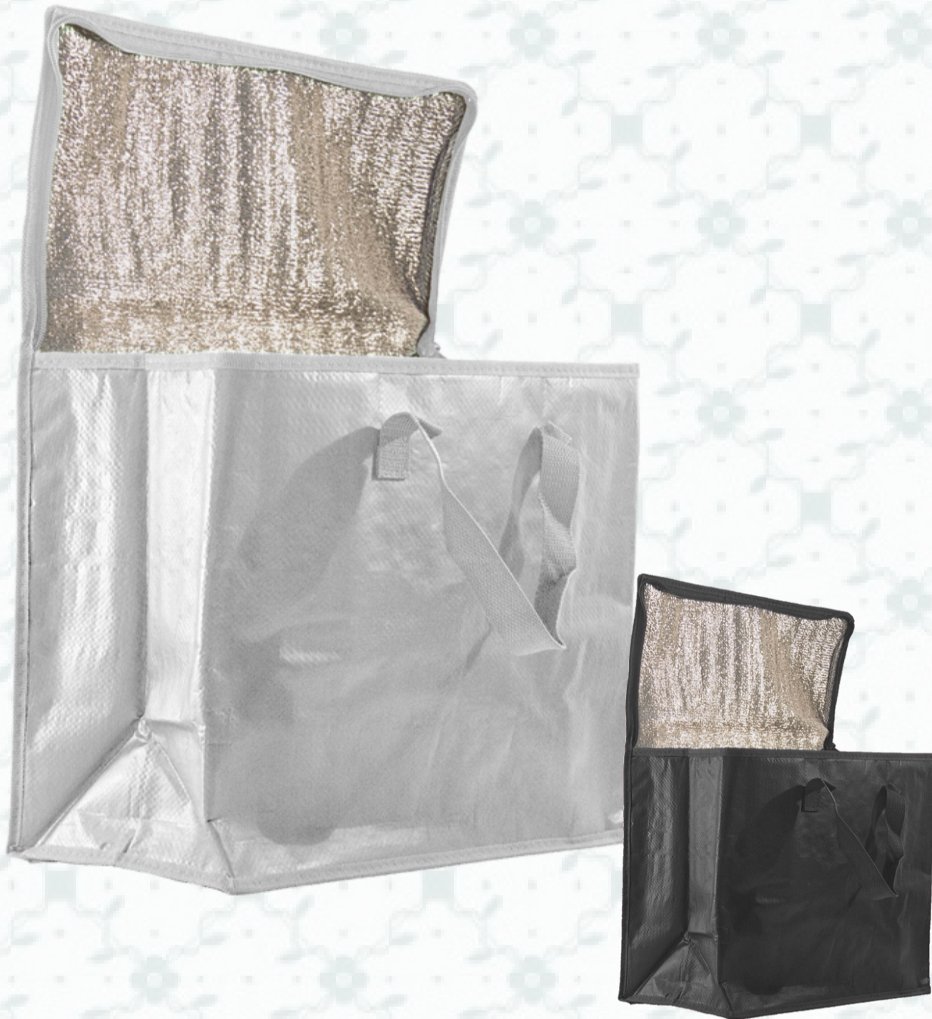
Ref : Sac polypro isolant HBSI1 36 + 20 x 30 cm - 5 coloris disponibles Personnalisation : nous contacter