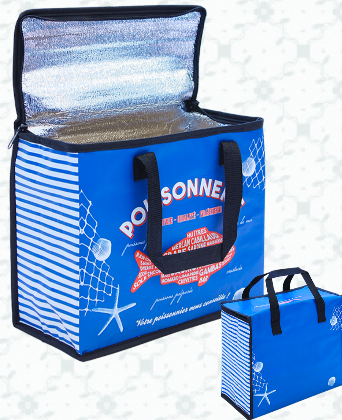
Ref : Sac polypro isolant HBSI6 30 + 15 x 25 cm Personnalisation : 1 couleur sur 1 face