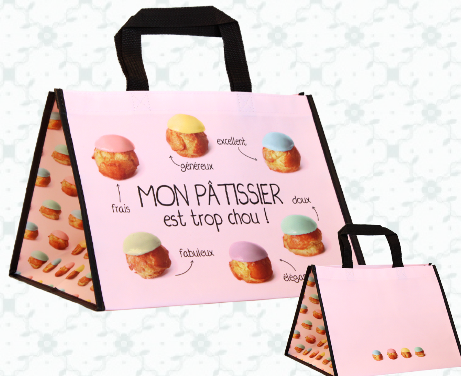
Ref : Sac polypro HBP55 36 + 30 x 27 cm Personnalisation : 1 couleur sur 1 face