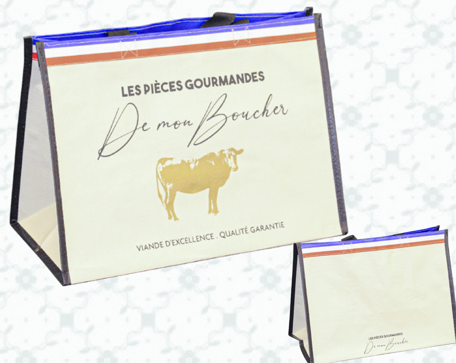
Ref : Sac polypro HBP32 36 + 20 x 27 cm Personnalisation : 1 couleur sur 1 face