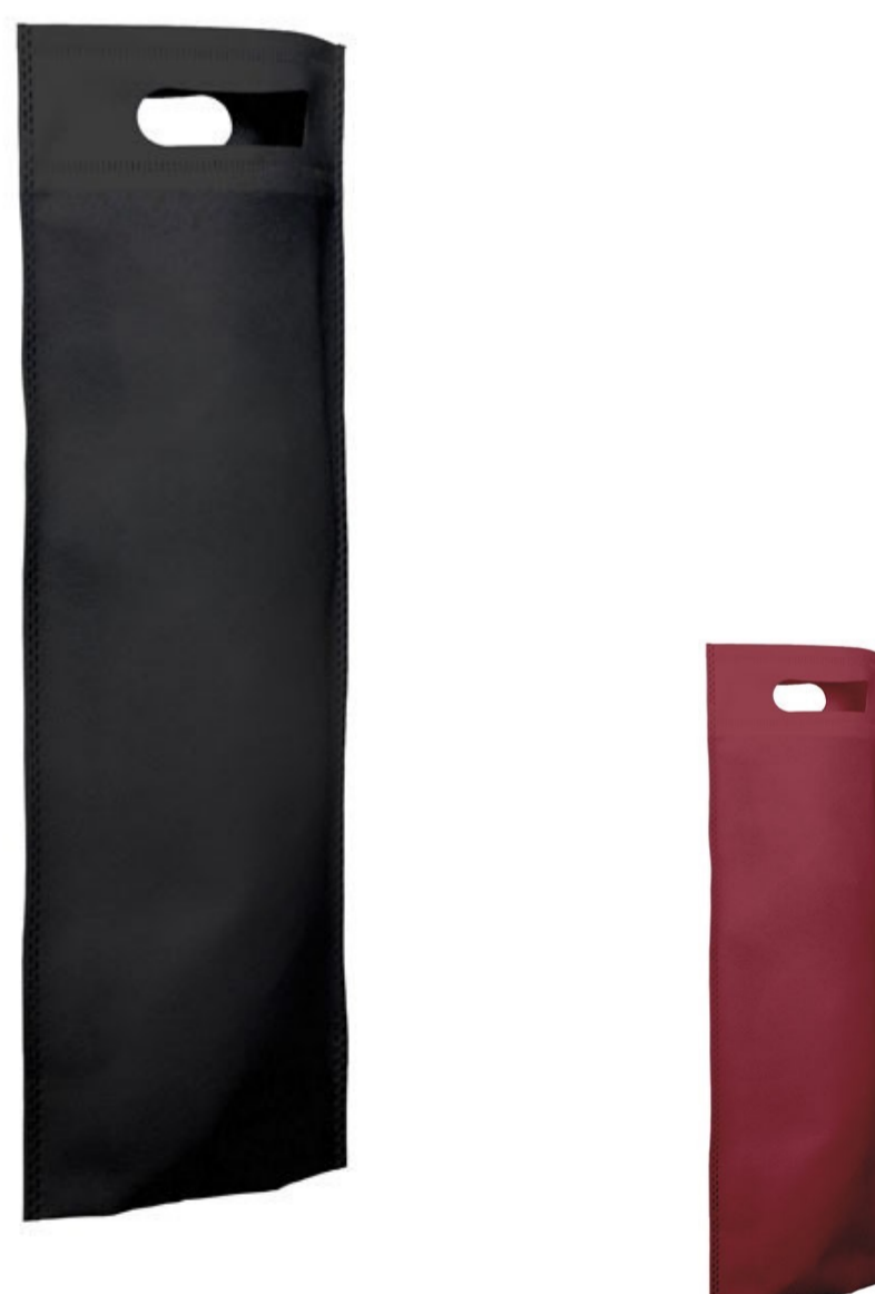
Ref : Sac polypro SINGER 16 + 10 x 40 cm - 8 coloris disponibles Personnalisation : 1 couleur sur 1 face