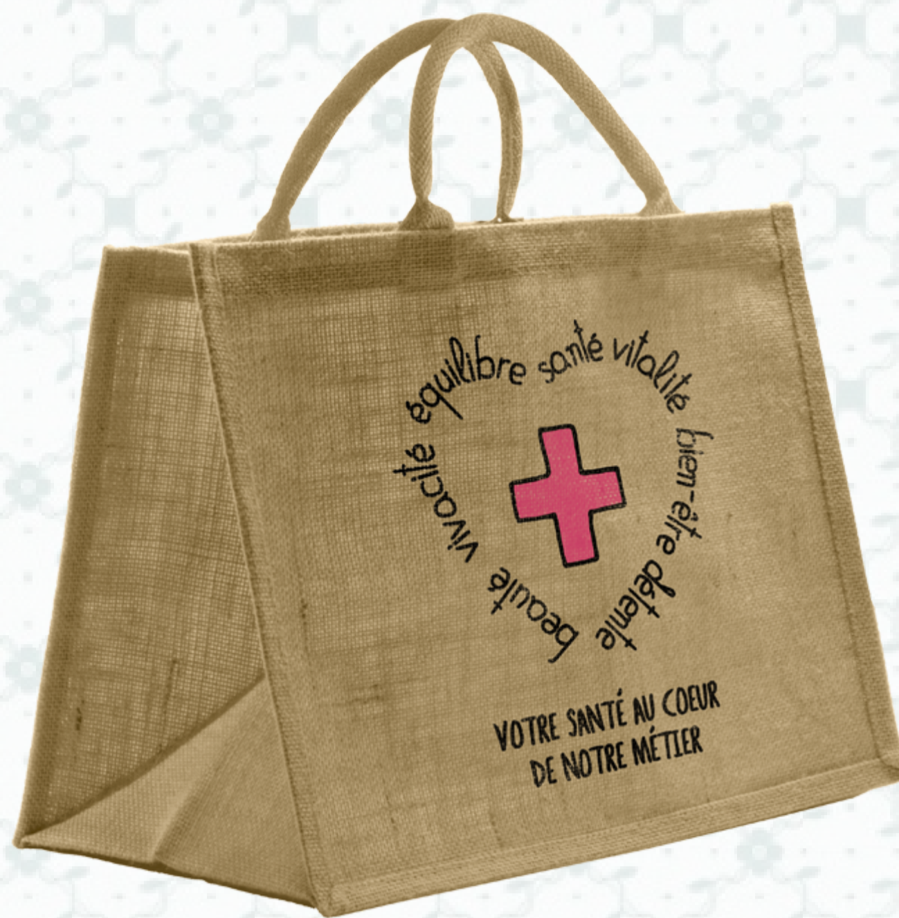
Ref : Sac toile de jute HBJ22 36 + 20 x 27 cm Personnalisation : 1 couleur sur 1 face