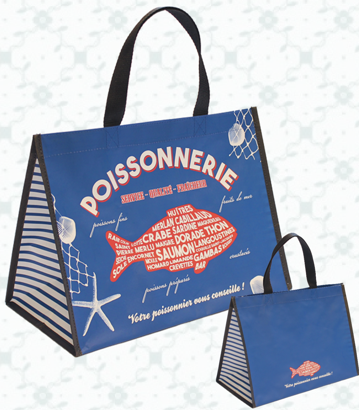
Ref : Sac Polypro HBP27 36 + 20 x 27 cm Personnalisation : 1 couleur sur 1 face

Découvrez nos designs spécialement conçus pour votre activité à travers notre gamme de cabas « Poissonnerie ». Un gain de temps mais pas seulement, ces sacs réutilisables extrêmement résistants sont parfaits pour diffuser votre marque sur du long terme.