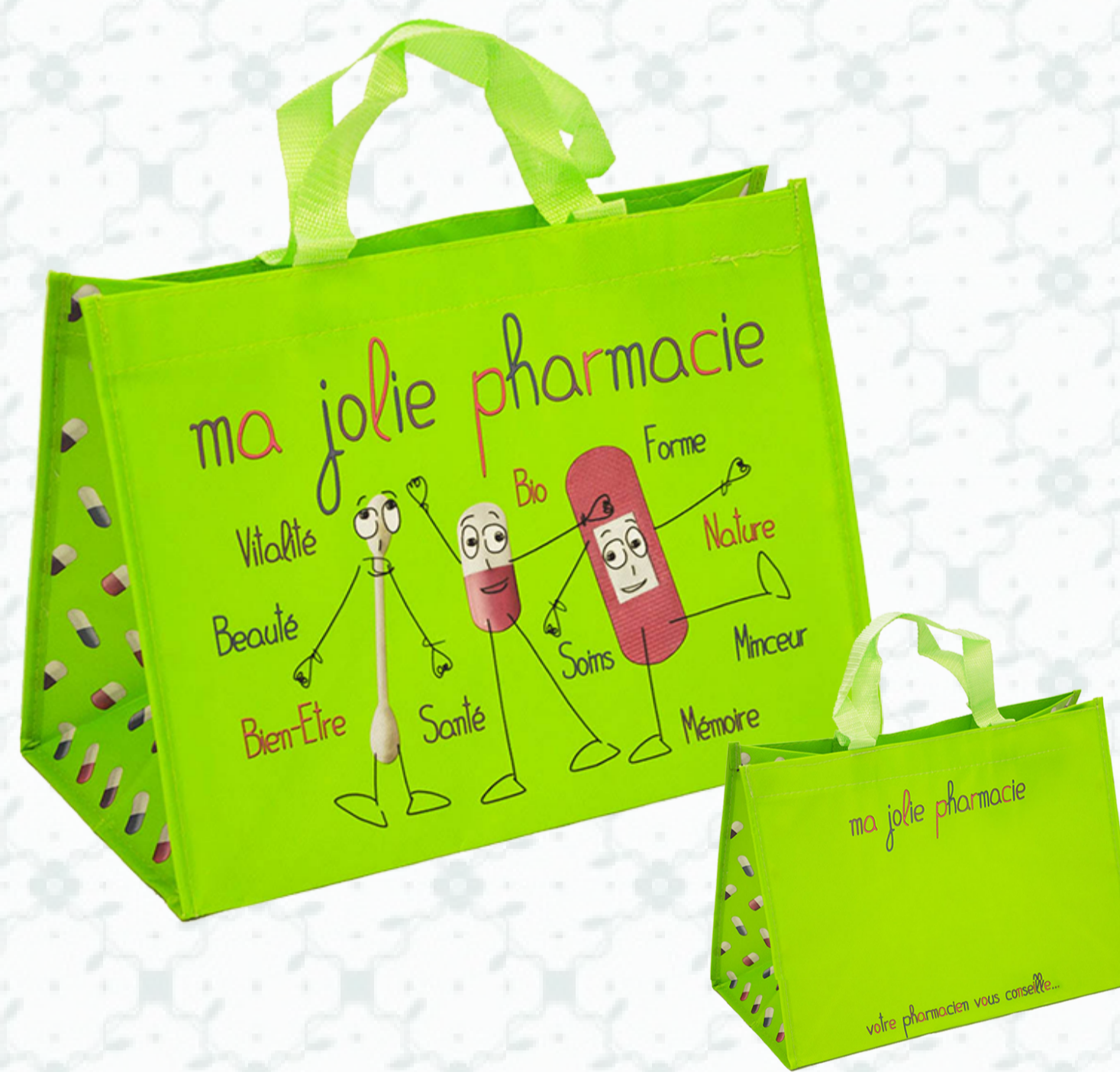
Ref : Sac polypro HBP36 36 + 20 x 27 cm Personnalisation : 1 couleur sur 1 face