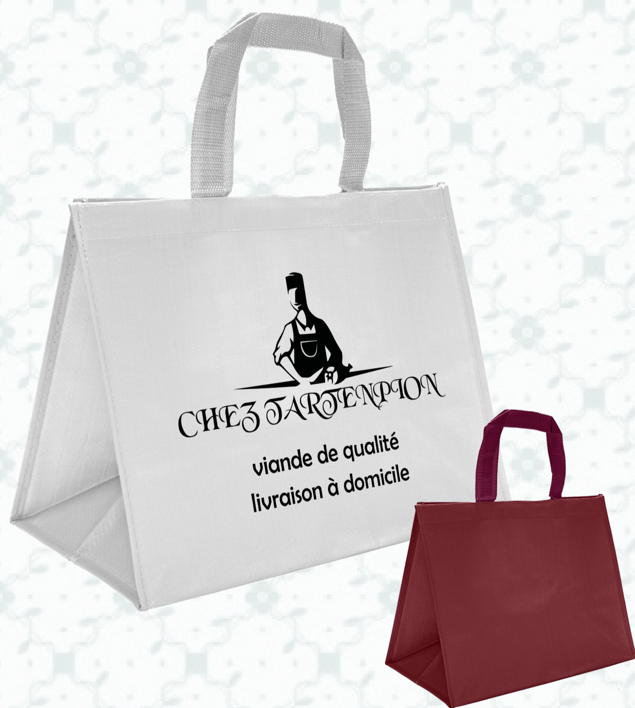
Ref : Sac polypro HBP22 36 + 20 x 27 cm - 7 coloris disponibles Personnalisation : nous contacter

Nos sacs isothermes permettent de conserver vos produits dans des conditions optimales, et ce tout en diffusant votre image de marque. Profitez également de designs spécialement conçus pour votre activité : boucherie, poissonnerie et fromagerie.