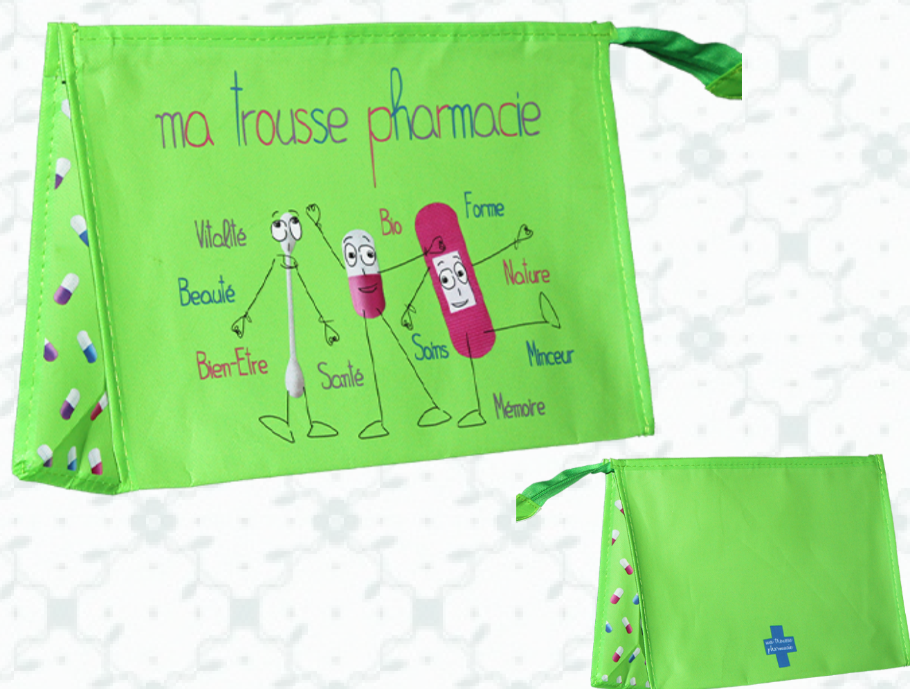
Ref : Sac polypro HBP109 30 + 10 x 20 cm Personnalisation : 1 couleur sur 1 face