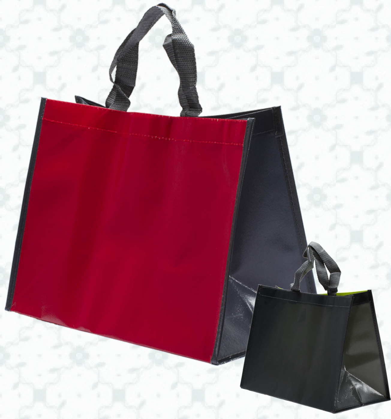
Ref : Sac polypro HBP6 36 + 20 x 27 cm - 4 coloris disponibles Personnalisation : 1 couleur sur 1 face